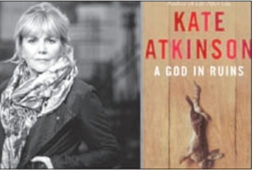
كيت اتكنسون على غلاف الرواية

وكالات: فازت الروائية البريطانية كيت اتكنسون بجائزة «كوستا» الأدبية عن روايتها «حطام الإله»، للمرة الثانية خلال 3 سنوات، وكانت اتكنسون قد فازت بالجائزة عام 2013 عن روايتها «حياة بعد حياة»، كما فازت بالجائزة أيضاً عام 1995 عن روايتها «خلف الكواليس في المتحف».