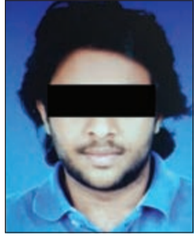
متنحل صفة الطبيب