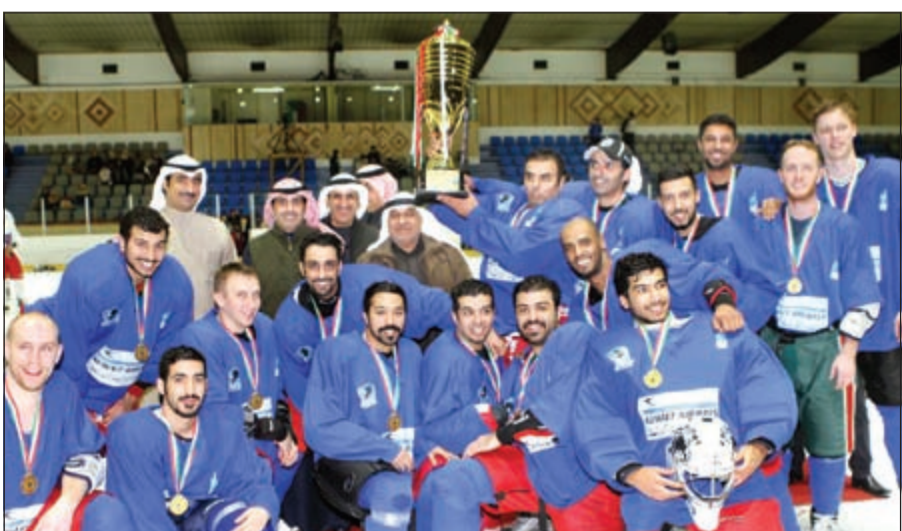
الفريق الفائز باللقب الثالث للدوري الوطني لهوكي الجليد

توج فريق الخطوط الجوية الكويتية بلقب بطولة الدوري الوطني الثالثة لهوكي الجليد لهذا الموسم بعد تغلبه على نظيره فريق سابليه 5-10، في المباراة النهائية التي أقيمت اول من امس على صالة التزلج. وأشاد نائب رئيس نادي الألعاب الشتوية خالد المطيري بمستوى الفرق المشاركة بالدوري وهي فرق شركة المشروعات السياحية والخليج للكيابلات اضافة لفرقي الكويتية وسابليه. وقال المطيري إن هذا المستوى المميز جعل من مدرب المنتخب الصربي ماركو بريزيفيتش ضم تسعة لاعبين جدد، تميزوا في الدوري إلى صفوف المنتخب الوطني الذي يستعد لخوض بطولة الخليج في الواجهة نهاية يناير الجاري. وأضاف أن المنتخب سيغادر نهاية الأسبوع الجاري إلى السويد لإقامة المعسكر التدريبي استعدادا للبطولة الخليجية، موجها شكره إلى الفرق المشاركة بالدوري وللخطوط الجوية الكويتية على دعمهم الكبير. وفي نهاية المباراة، قام المدير التنفيذي لمؤسسة الخطوط الجوية الكويتية الذي حضر نيابة عن رئيسة مجلس إدارة المؤسسة رشا الرومي برفقة رئيس وأعضاء مجلس إدارة النادي بتتويج الفريق الفائز وتكريم الفرق المشاركة في البطولة.