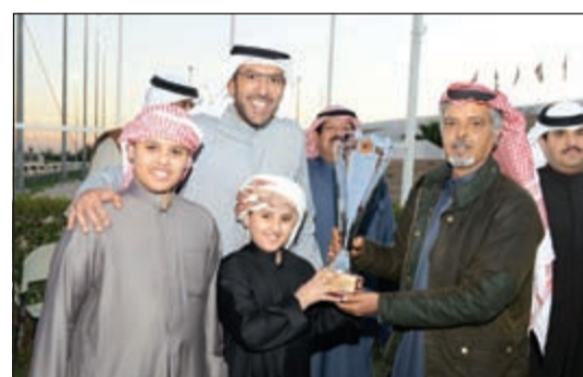
الشيخ ضاري الفهد يسلم الفائز بالجائزة

واصل الجواد الرائع (شلاع) لاسطبل المريخي انتصاراته عندما سجل فوزه الرابع على التوالي اثر