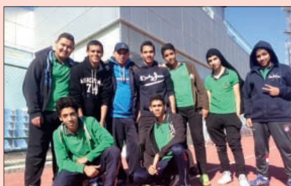
طلاب مدارس الإخلاص كان لهم حضور قوي في المنافسات