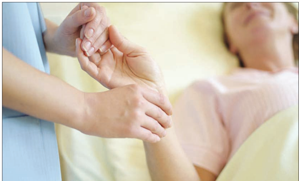
ترسب الدهون في جدار الشرايين يحدث الجلطة