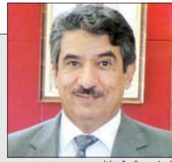
السفير سالم الزمانان