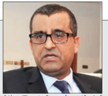
السفير التونسي أحمد بن الصغير (قاسم باشا)

الزمانان لـ «الأنباء»: النيابة العامة المصرية تحقق في ملابس قتل الطالب الكويتي لزميله.. وجماعته يصل اليوم 05