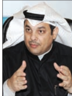
الوزير يعقوب الصانع

أكد وزير العدل ووزير الأوقاف والشؤون الإسلامية يعقوب الصانع أنه لن يسمح بسيطرة أي فكر أو تيار سياسي أو اجتماعي على وزارة الأوقاف. وقال الصانع خلال لقاء «الأنباء» أنه أكثر وزير يطبق سياسة الإحلال في الوزارات والجهات التابعة له، مشددا على أن «الأولوية لابن البلد».