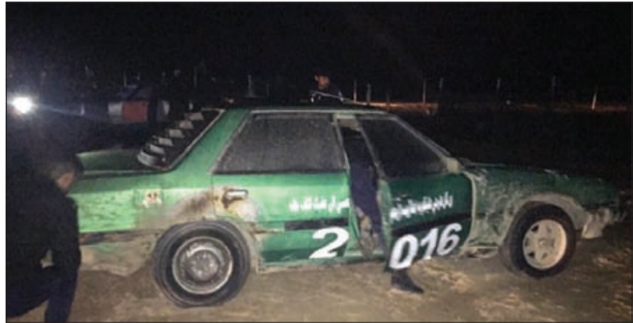
سيارات متهاكة أحييت إلى جراج الحجز