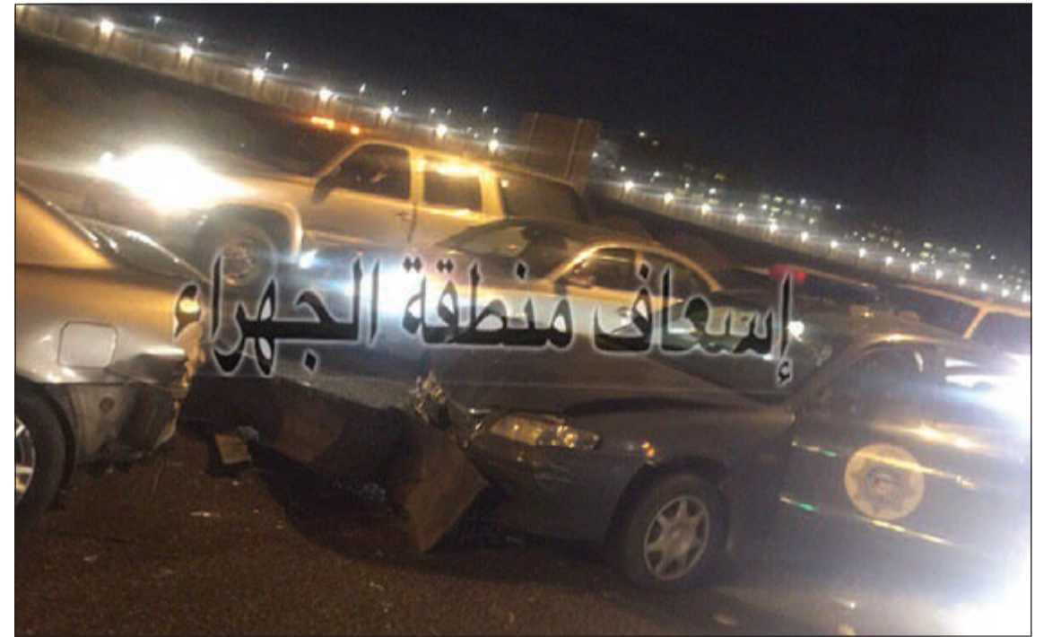
من الصور التي توثق على موقع الإسعاف وتعلق بحوادث مرورية

القائم على الحساب يقوم أيضاً بشرح تفصيلي عن المنزل الذي حدثت به المشكلة الأمر الذي تترتب عليه عدة أمور، وقال المصدر ان الحساب نادراً ما ينشر ما يخص الإسعاف من توعية على عكس الحوادث التي تجد من يدير الحساب والقائمين عليه بنشرها.