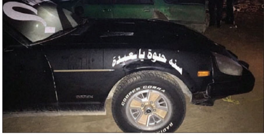
عبارات بدون مضمون كتبت على مركبات المستهترين