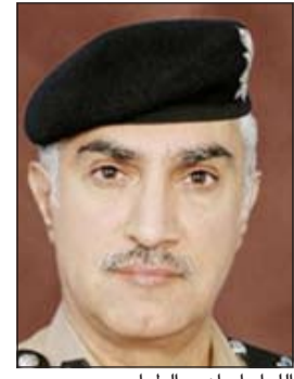
اللواء إبراهيم الطراح