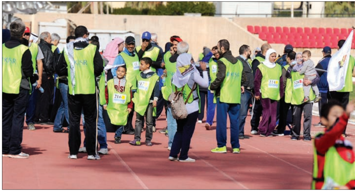
جانب من المشاركين في المسابقة