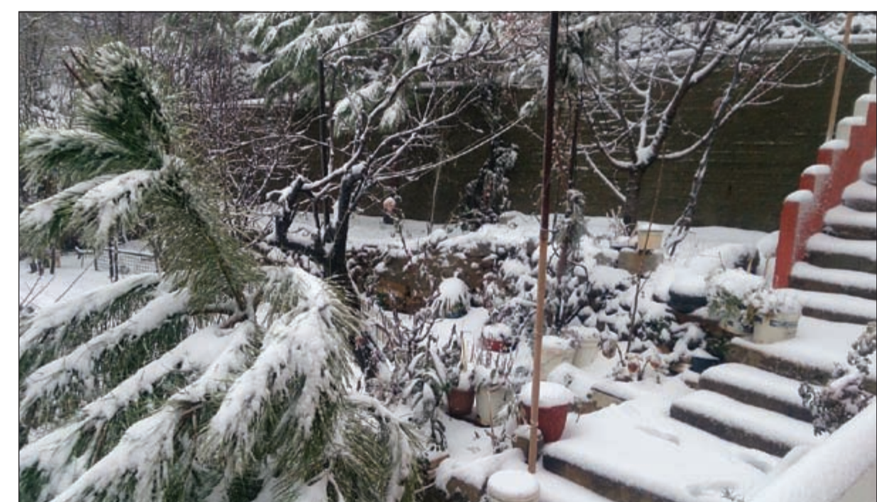
العاصفة الثلجية فلاديمير تغفل الطرقات في المناطق الجبلية في لبنان