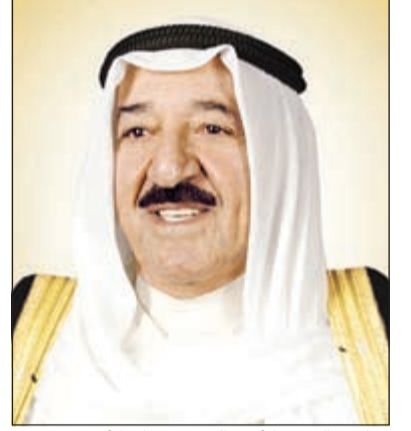
صاحب السمو الأمير الشيخ صباح الأحمد

سختلف كل حسب طبيعة عمله ومهامه. وختتمت المصادر قائلة: إنه فور الانتهاء من هذه الدراسة سيكون هناك اجتماع مخصص لمناقشة هذه الزيادات بحضور أعضاء اللجنة إضافة إلى ممثل من وزارة المالية، ومن ثم رفعها إلى مجلس الدفاع الأعلى لإقرارها.