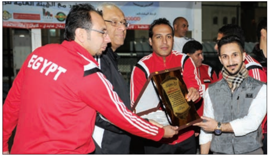
جانبا من اليوم المفتوح

قامت «Ooredoo الكويت»، إحدى شركات مجموعة «Ooredoo العالمية للاتصالات»، برعاية اليوم المفتوح الذي أقامته سفارة جمهورية مصر العربية في الكويت، يوم الجمعة 25 ديسمبر 2015 في ساحة السفارة الرياضية التابعة لهيئة العامة للشباب والرياضة، وذلك بحضور ومشاركة السفير المصري في الكويت ياسر عاطف.