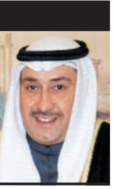
الشيخ فيصل الجمود المالك الصباح - محافظ المفراتية