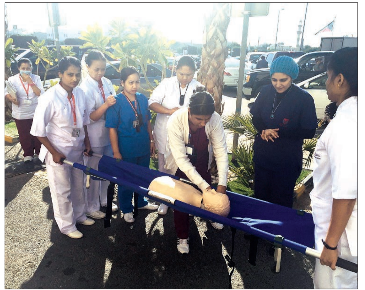
جانب من التدريب

بدأت رحلة مصمم الأزياء الإيطالي Roberto Cavalli المبدعة من فلورنسا في عام 1979، حيث حاز براءة اختراع إجراء الطباعة على الجلود، وبدأ بصنع القطع الفنية المذهلة بتقنيات جديدة تستخدم لأول مرة في باريس، وافتتح Roberto Cavalli متاجر عديدة في سانت بارت، في منطقة البحر الكاريبي الفرنسية، تليها أخرى في البندقية وسان تروبيه إلى جانب الخط الرئيسي، الذي يباع في أكثر من خمسين بلداً في جميع أنحاء العالم، وفي عام 1998 أطلق Roberto Cavalli مجموعة JUST CAVALLI، التي تضم، الملابس والإكسسوارات الرجالية والنسائية، والنظارات، والساعات، والمجوهرات، والعمود من الدرجة الأولى، المجموعتين الملابس الداخلية والأحذية والنظارات والساعات والعمود، وفي 18 يونيو عام 2013، حصل على دبلوم الماجستير الفخرية في إدارة الموضة من دوموس الأكاديمية في ميلانو، ومع مجموعة الإكسسوارات من JUST CAVALLI تحيد عن