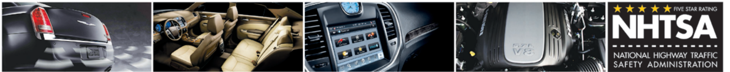
حساسات الركن الأمامية والخلفية مع كاميرا للرؤية الخلفية

* عداد أقل من 150 كيلومتر. * ضمان المصنع لمدة 3 سنوات.