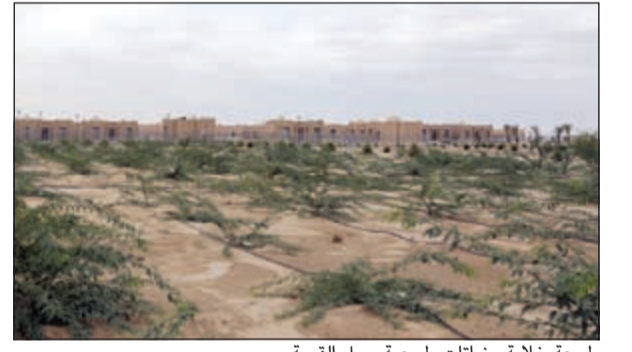
طبيعة خلابة ونباتات طبيعية حول القرية