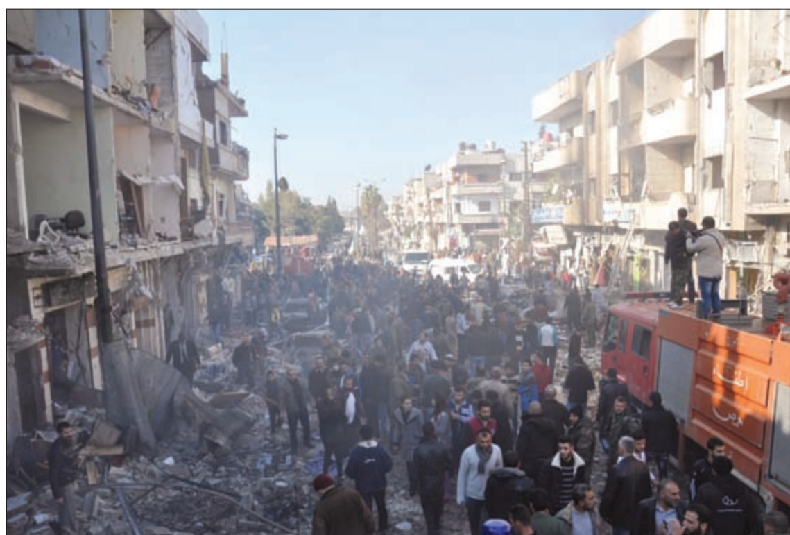
جانح من الدمار الذي لحق بحي الزهراء في حمص نتيجة التفجيرات

عواصم - وكالات: قال ناشطون ومصادر رسمية سورية إن ما لا يقل عن 32 شخصا قتلوا وأصيب 90 آخرون في انفجارين بمدينة حمص السورية أمس. وقال المرصد السوري لحقوق الإنسان إن الانفجارين وقعا «جسرا تفجير رجل لنفسه بحزام ناسف وتفجير آلية مفخخة على الأقل في حي الزهراء» الموالي. وتضاربت المعلومات حول عدد التفجيرات وأسبابها وحصيلة القتلى، إذ تحدث التلفزيون السوري الرسمي عن «تفجير سيارتين مفخختين وحزام ناسف في محيط الساحة الرئيسية»، فيما اشار محافظ حمص طلال البرازي لوكالة فرانس برس إلى «تفجير سيارة مفخخة اعقبها اقدام انتحاري على تفجير نفسه بحزام ناسف». وتحدثت وكالة الأنباء السورية الرسمية «سانا» بدورها عن «تفجيرين انتحاريين بسيارتين مفخختين». وقال المرصد ان «عدد الخسائر البشرية مرشح للارتفاع لوجود جرحى في حالات خطيرة». ويث التلفزيون مشاهد من الحي تظهر دمارا كبيرا في المباني والمحال التجارية، وسيارات اطفاء تعمل على