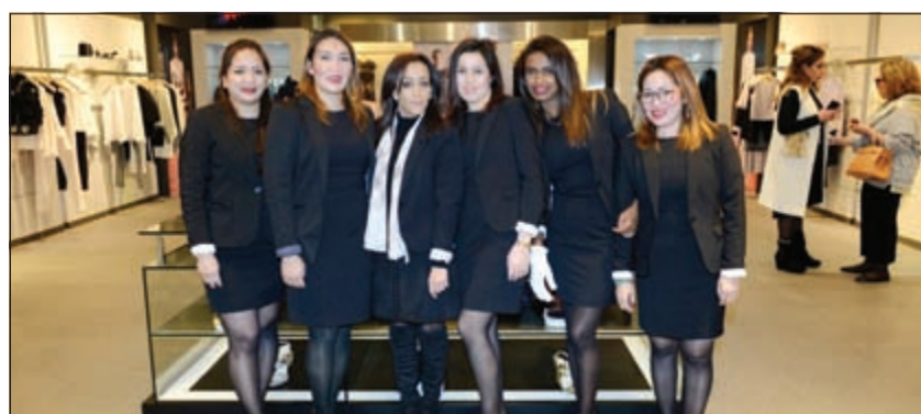
من فريق العمل