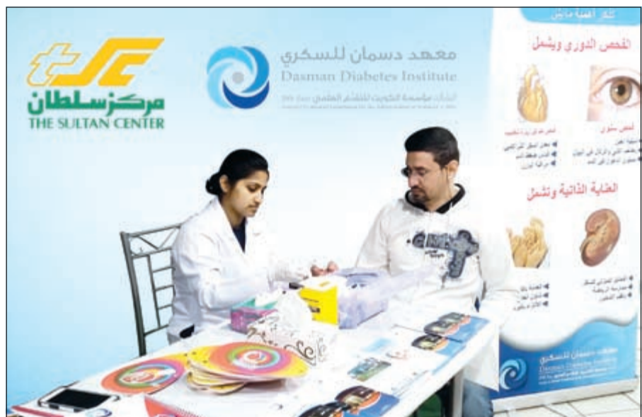
جانب من حملة مركز سلطان ومركز دسمان لعلاج السكري