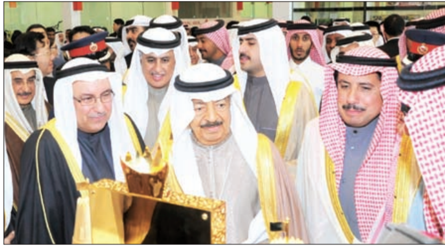
رئيس الوزراء البحريني الأمير خليفة بن سلمان والسفير الشيخ عزام الصباح خلال افتتاح مدينة التين الصينية في البحرين

يستفيد منها المستثمر الكويتي، معربا عن شكره وتقديره للجهات المختصة في المملكة بتقديم التسهيلات اللازمة وتذليل وإزالة كل المعوقات أمام المستثمر الكويتي، لافتا الى أن القيادة السياسية في الكويت تشجع القطاع الخاص على أخذ زمام المبادرة لدفع عجلة التنمية. يذكر أن مدينة التين الصينية هي جزء من مشروع ديار المحرق، أحد أكبر مشروعات التطوير العقاري وتقع في الجزء الشمالي لمدينة المحرق البحرينية ويمتلك بيت التمويل الكويتي 50٪ منها.