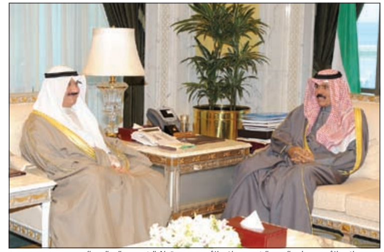
سمو نائب الأمير وولي العهد الشيخ نواف الأحمد مستقبلا الشيخ سالم العبدالعزير