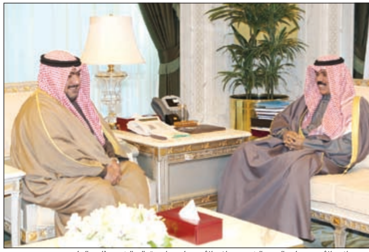
سمو نائب الأمير وولي العهد الشيخ نواف الأحمد لدى استقباله الشيخ ثامر العلي

الكارثة الطبيعية. وبعث سمو نائب الأمير وولي العهد الشيخ نواف الأحمد بمرقية تعزية إلى رئيس الولايات المتحدة الأمريكية الصديقة باراك أوباما ضمنها سموه خالص تعازيه والأعاصير والفيضانات التي اجتاحت جنوب ووسط الولايات المتحدة، متمنيا سموه للضحايا الرحمة وللمصابين سرعة الشفاء، راجيا سموه أن يتمكن المسؤولون في البلد الصديق من تجاوز آثار هذه