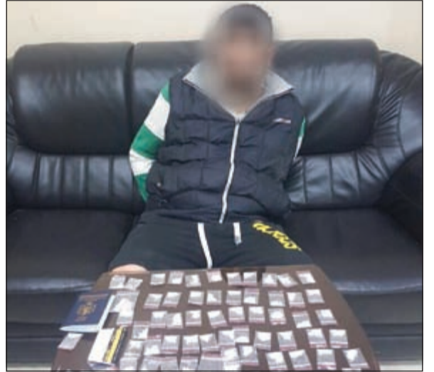
المتهم الأردني وامامه كمية الشبو

بحوزته على زجاجة ماء صلبة وبها مادة صفراء، بالإضافة الى فرشاة صغيرة يشتهه في ان بها مادة مسكرة، كذلك تم ضبط سيجارة يشتهه في ان بها مخدرا وكذلك عدد 8 ابر. أيضا تمكنت نقطة التفتيش نفسها من توقيف حدث خليجي وبحوزته كيس شفاف بداخله 4 حبات بيضاء يشتهه بانها كبتي وكيس شفاف آخر به مادة بيضاء يعتقد انها شبو.