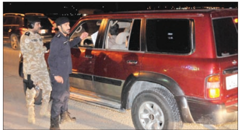
توعية احد المواطنين قبل التخيم

ضمن فعاليات حملة «سالم 2» التوعوية، والتي انطلقت امس، تواجد عدد من الضباط وضباط الصف من الإدارة العامة للاطفاء في النقطة الأمنية بمحافظة الجهراء، وذلك بالتعاون مع وزارة الداخلية بتواجد الوكيل المساعد لشؤون أمن الحدود البرية اللواء محمد اليوسف ومدير عام الإدارة العامة لأمن الحدود البرية اللواء فؤاد الاثري وضابط التفتيش المقدم مشعل الدويش ورئيس الامن الغربي الرائد احمد العنزى، حيث