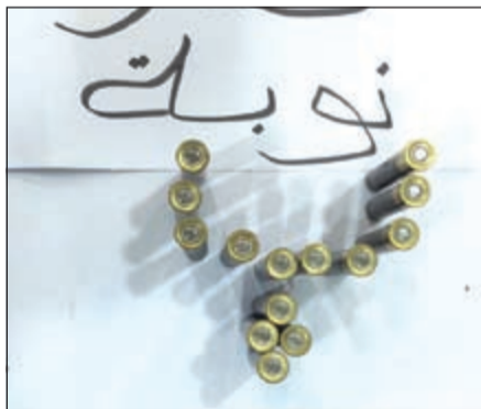
الطلقات التي تم العثور عليها