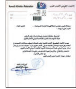
صورة لكتاب الاتحاد الدولي لاعاب القوى