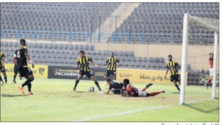
الأهلي كاد يفرق في وادي دجلة