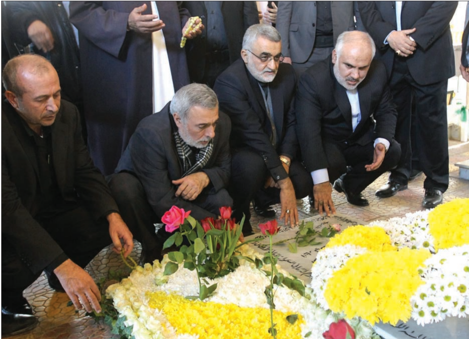
رئيس لجنة الأمن القومي والسياسة الخارجية في البرلمان الإيراني علاء الدين بروجردي يزور قبر سمير القنطار في بيروت امس