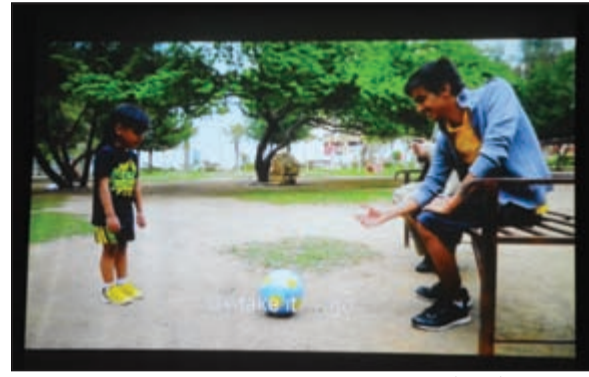
مشهد من فيلم «تذكرني»

الفيلم الأخير «بيتي» مأساة غزوة ووقوف الدول العربية إلى جوارها وتقديمها للغذاء والدواء لأهالي القطاع المنكوب، ليقدّم رسالة إلى الجميع مفادها بأن غزوة تحتاج إلى الأمان وليس الغذاء وتواجه المحتل بمفردها، مبيّنا أن الكثير من الأشخاص طالبوا بترجمة هذه الأفلام وبالفعول تمت ترجمتها، لافتا إلى أن هناك برنامجا كوميديا تحت اسم «استفهام» يتحدث بطريقة كوميدية عن عادات وتقاليد المجتمع. ولفت العنزي إلى أن مشاركتهم في المهرجان شيء جميل خاصة أن الهيئة