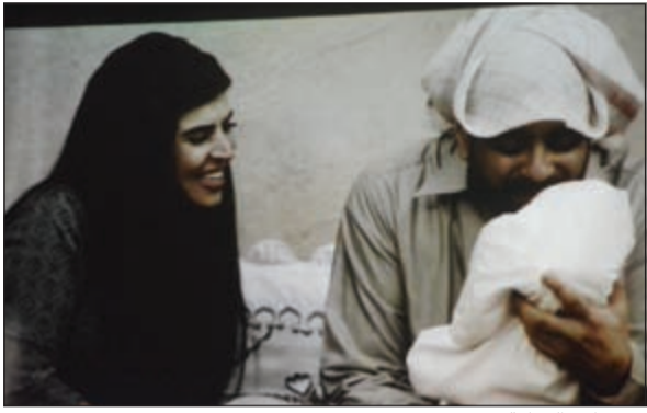
من فيلم «الزولية»