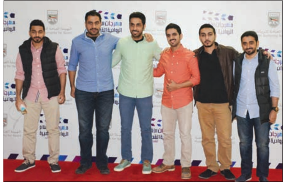
عدد من الشباب المشاركين بأعمال فنية في المهرجان

وحيدى: المهرجان تأكيد على أن الشباب هم النبض الحقيقي لبناء المسيرة السينمائية في الكويت