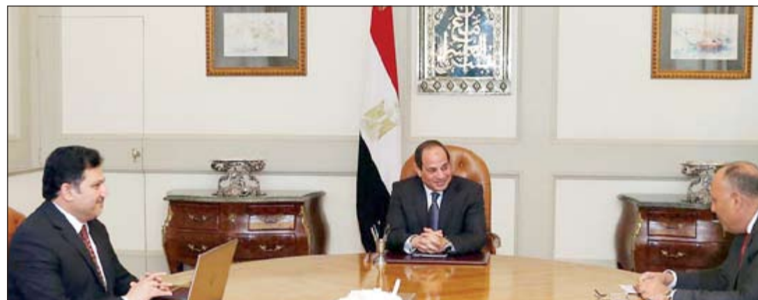
الرئيس عبدالفتاح السيسي مجتمعاً بسامح شكري ودحسام مغازي

القاهرة - أ.ش.: اجتمع الرئيس عبدالفتاح السيسي، أمس الأول بوزير الخارجية سامح شكري ووزير الموارد المائية والري د.دحسام مغازي لبحث تداعيات ملف سد النهضة والتحضير للاجتماع السداسي المقبل لسوزاء الخارجية والري، في كل من مصر والسودان وإثيوبيا بشأن السد المقرر عقده في الخرطوم غدا الموافق 27 ديسمبر الجاري. وقال السفير علاء يوسف، المتحدث الرسمي باسم الرئاسة المصرية، إنه تم التأكيد خلال الاجتماع على أهمية التوصل إلى تفاهم مشترك بين الدول الثلاث بما يحفظ حقوق الدول الثلاث وشعوبها في التنمية والحياة، أخذا في الاعتبار التطلعات في التنمية، وكذا حق الشعب المصري في الحياة باعتبار نهري النيل المصدر الوحيد للمياه في مصر. وأضاف أن الاجتماع تطرق إلى أهمية الاستثمار في اتخاذ إجراءات بناء الثقة بين الدول الثلاث وفقا لإعلان المبادئ الذي تم التوقيع عليه بالخرطوم في مارس 2015. لاسيما أن مصالح المشتركة بين مصر والسودان وإثيوبيا لا يمكن أن تنحصر فقط في مجال المياه، ولكن تمتد لتشمل العديد من أوجه التعاون بل والتكامل الاقتصادي.