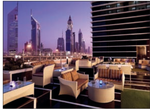
إطلالة التراس على شارع الشيخ زايد