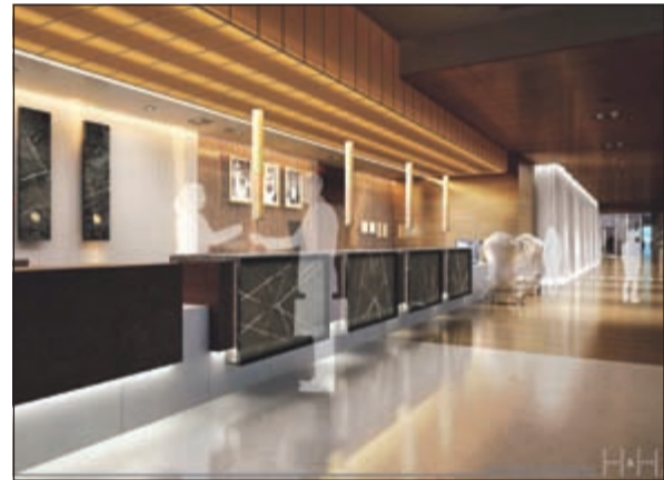
الروبي الجديد للفندق

الرحيحية العالية في أسواق مستقرة كتلك الاستثمارات التي حققها الشركة بالفعل في دبي والفجيرة. دراسات وتحليلات وأشار إلى أن الاستثمار في سوق الفنادق الفاخرة في إمارة دبي جاء بعد دراسات مستفيضة وتحليلات معمقة حول توجهات نمو قطاع السياحة والترفيه في المنطقة، معرباً عن فخره بالتحالف الأخير الذي تم بين «فندق نسيمة رويال» و«برج نسيمة للشقق الفندقية»، وهي الخطوة التي جاءت في إطار تقديم خدمات فندقية متكاملة لختلف شرائح زوار مدينة دبي، مؤكداً أن مثل هذه الخطوة من شأنها أن تدعم وتوسع رسوخ علامة الشركة وموقعها في السوق العالمية. وأضاف أن «أسيكو للفنادق» تحرص دائماً على تلبية احتياجات الزائر والمقيم في دولة الإمارات العربية المتحدة، خاصة أنها تترك تماماً حجم المنافسة في سوق الفنادق في هذا السوق الحيوي، لذا فإنها تحرص على تقديم العديد من الخدمات المتطورة والمتجددة والمنافسة في الوقت ذاته، سواء