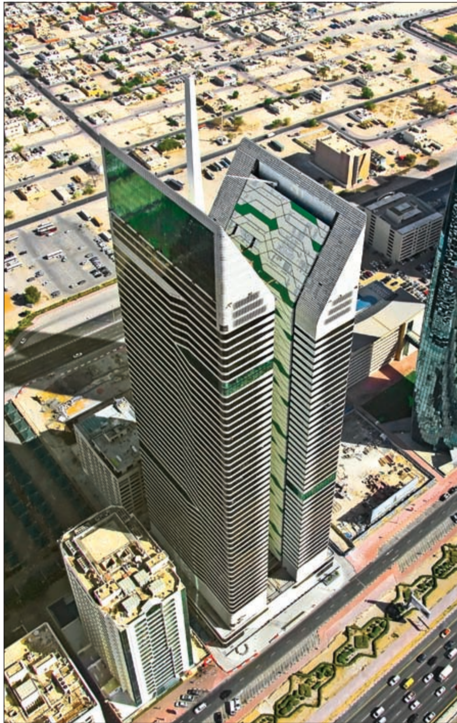
فندق «نسيمة رويال»، و«نسيمة للشقق الفندقية»

تجربة فريدة ورائعة خضناها مع فندق «نسيمة رويال» قضينا خلالها ليلتين من الرفاهية والراحة وسط خدمات متعددة وعلى أعلى مستوى من الجودة. ورغم أن التجربة كانت قصيرة جداً، إلا أننا عرفنا لماذا تم اختيار «نسيمة رويال» ضمن شبكة (بريفيرد هوتيلز) والتي تضم في عضويتها 500 فندق من أكبر الفنادق العالمية، وكما يقال إذا «عرف السبب بطل العجب»، فالفندق قد تم تصميمه وتنفيذه على أعلى مستوى من التشطيبات والتصاميم والتأقيث، فضلاً عن أنه يحتوي على كل الخدمات والمرافق الضرورية التي يحتاجها السائح والزائر. ويضم الفندق مجموعة رائعة من المطاعم المختلفة، إلى جانب النادي الصحي، وحمام السباحة الخارجي ذو الإطلالة المتميزة، إلى جانب قاعات كبيرة للاحتفالات والمؤتمرات، هذا إلى جانب مبنى مستقل للشقق الفندقية الراقية ذات الغرفة الواحدة والغرفتين، والأجنحة الرئيسية، والتي تم تصميمها بشكل يضمن استقطاب العائلات الكبيرة التي تبحث عن مكان رجب ومتكامل في قلب مدينة دبي.