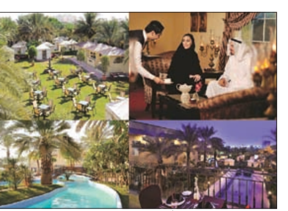
اختيارات متنوعة بفندق موقنبيك الكويت