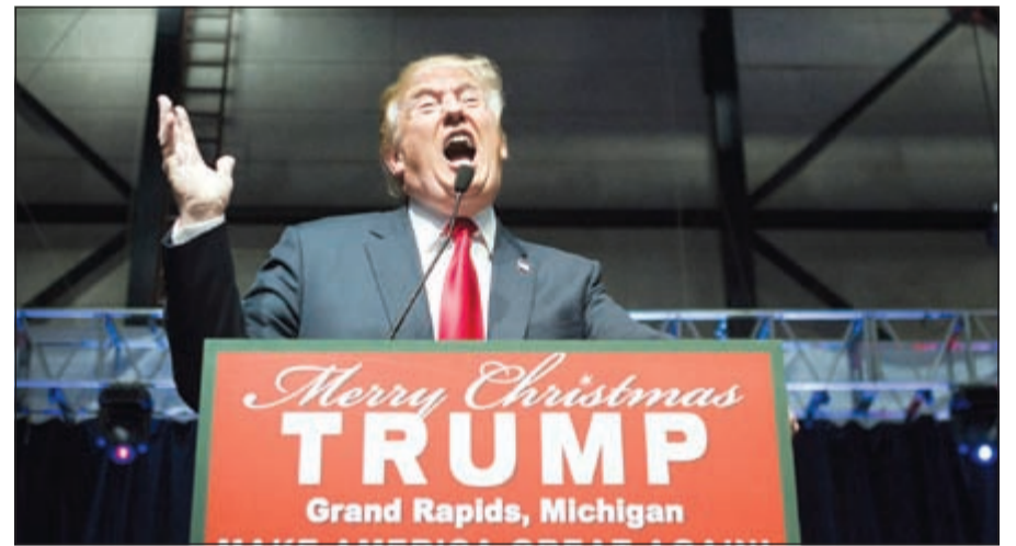
دونالد ترامب يتحدث أمس الأول في ميتشيجان

في المملكة العربية السعودية سحبت كتباً عن حوث العقارات الأمريكي ترامب. ونشرت المكتبة تغريدة أمس وقالت فيها «تم سحب النسخ من المكتبة. تشكر لك ملاحظتك». وتكبد ترامب خسائر في أعماله بالشرق الأوسط بسبب تصريحاته حيث أوقفت سلسلة من المتاجر الكبرى مبيعات منتجات «ترامب هوم» من المصاييح والمرايا وصناديق المجوهرات. من جهته، وصف أنطونيو غوتيريس، المفوض السامي للأمم المتحدة لشؤون اللاجئين، الدول التي ترفض استقبال اللاجئين، مجرد كونهم مسلمين، بـ«حلفاء داعش» والجماعات الإرهابية الأخرى.