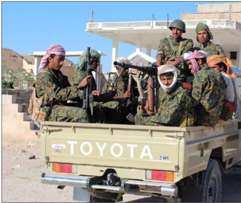
مقاتلون مواليون للرئيس عبدربه منصور هادي خلال قيامهم بدورية في محافظة شبوة

وصعد المتمردون الحوثيون خرقهم للهدنة وتجاهلهم لحادثات السلام التي كانت منعقدة في سويسرا خلال الأيام الماضية، وزادوا من عملية إطلاق الصواريخ الباليستية صوب مواقع سعودية ومقرات للقوات الموالية للرئيس اليمني عبد ربه منصور هادي في «مارب»، شرقي اليمن، لكن المنظومة الدفاعية للتحالف انبطلت مفعولها. وشهدت مناطق مختلفة من اليمن أمس طيران التحالف بقيادة السعودية، شن صباح أمس غارات على مناطق في جنوب اليمن، لاسيما الرامدة والشريجة الواقعتين في مناطق حدودية بين محافظتي تعز ولحج. وذكّر بن رعد أن 70٪ من سكان اليمن يعتمدون على بعض المساعدات الإنسانية. وأشار إلى أن أكثر من 2700 يمني قتلوا منذ بدء الأزمة في اليمن، معتبرا أن فشل الدولة باليمن سيفتح مسارات أمنية لتتظلم داعش. ودعا المفوض السامي إلى إزالة كل المعوقات التي تمنع توزيع الإعانة الإنسانية.