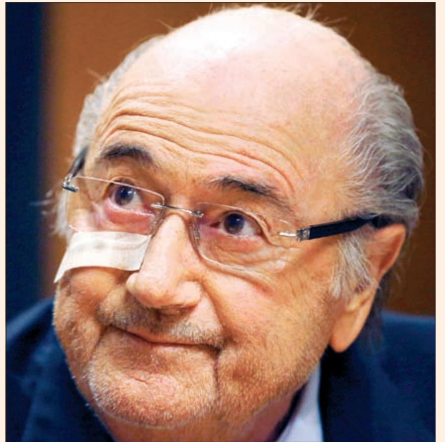
جوزيف بلاتر كما بدا في المؤتمر الصحافي

اعلنت غرفة الحكم في الاتحاد الدولي لكرة القدم (فيفا) امس إيقاف الرئيس المستقبلي السويسري جوزيف بلاتر ورئيس الاتحاد الأوروبي للعبة الفرنسي ميشال بلاتيني لمدة 8 أعوام عن ممارسة أي نشاط مرتبط بكرة القدم في قضية «دفع غير شرعي» من الاول الى الاخير عام 2011 يصل السى مليوني دولار عن عمل قام به الفرنسي لمصلحة الفيفا بين 1999 و2002. واسقط القضاء الداخلي لفيفا تهم الفساد عن بلاتر وبلاتيني لكنه اتهمهما بـ«تضارب المصالح» و«سوء الإدارة». كما غرمت بلاتيني 80 الف فرنك سويسري (74 الف يورو)، وبلاتر 50 الف فرنك سويسري (46295 يورو). ويملك بلاتر وبلاتيني اللذان كانا حتى الآن أقوى مسؤولين في عالم كرة القدم، فرصة الاستئناف امام الفيفا ثم بعد ذلك امام محكمة التحكيم الرياضي، بيد ان ضيق الوقت في حسم القضية نهائياً قد يحرم بلاتيني من الترشيح لرئاسة الفيفا في 26 فبراير المقبل. ويمكن لبلاتيني اللجوء الى محكمة التحكيم الرياضي بيد انه يتعين عليه الحصول على موافقة الفيفا وهو غير مرجح بحسب مصادر مقربة من الهيئة الكروية العالمية. وفي مؤتمر صحافي حزين، أكد رئيس الاتحاد الدولي لكرة القدم (فيفا) المستقبلي السويسري جوزيف بلاتر امس انه يشعر