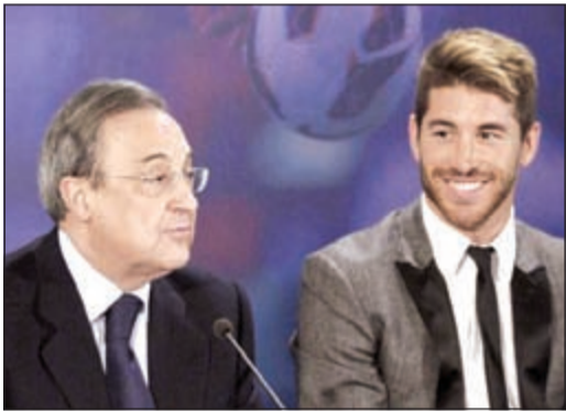
راموس ودعم لا محدود لقرارات رئيس النادي

أعرب اللاعب الإسباني سيرخيو راموس نجم دفاع ريال مدريد عن تأييده لرئيس النادي فلورينتينو بيريز. وأشار راموس إلى التصريحات التي أطلقها بيريز الشهر الماضي عندما قال ان رافاييل بينتيز المدير الفني للفريق الملكي هو «الحل وليس المشكلة» بالنسبة للنادي الذي يحتل المركز الثالث في ترتيب جدول أندية الدوري الإسباني. وقال راموس في تصريحات صحافية عقب فوز فريقه 2-10 على رايو فايكانو الذي خاض معظم فترات المباراة بتسعة لاعبين فقط: «إذا كان الرئيس قال هذا فذلك لأنه يرى سبباً وجيهاً.. نحن بيادق وهو الملك». واختتم قائلاً: «نحن جميعاً ندعم الرئيس.. إنه يحاول تطبيق أفكاره الخاصة ونحن نحاول المساعدة على تنفيذها.. كل لاعب يحاول القيام بهذا على طريقته الخاصة».