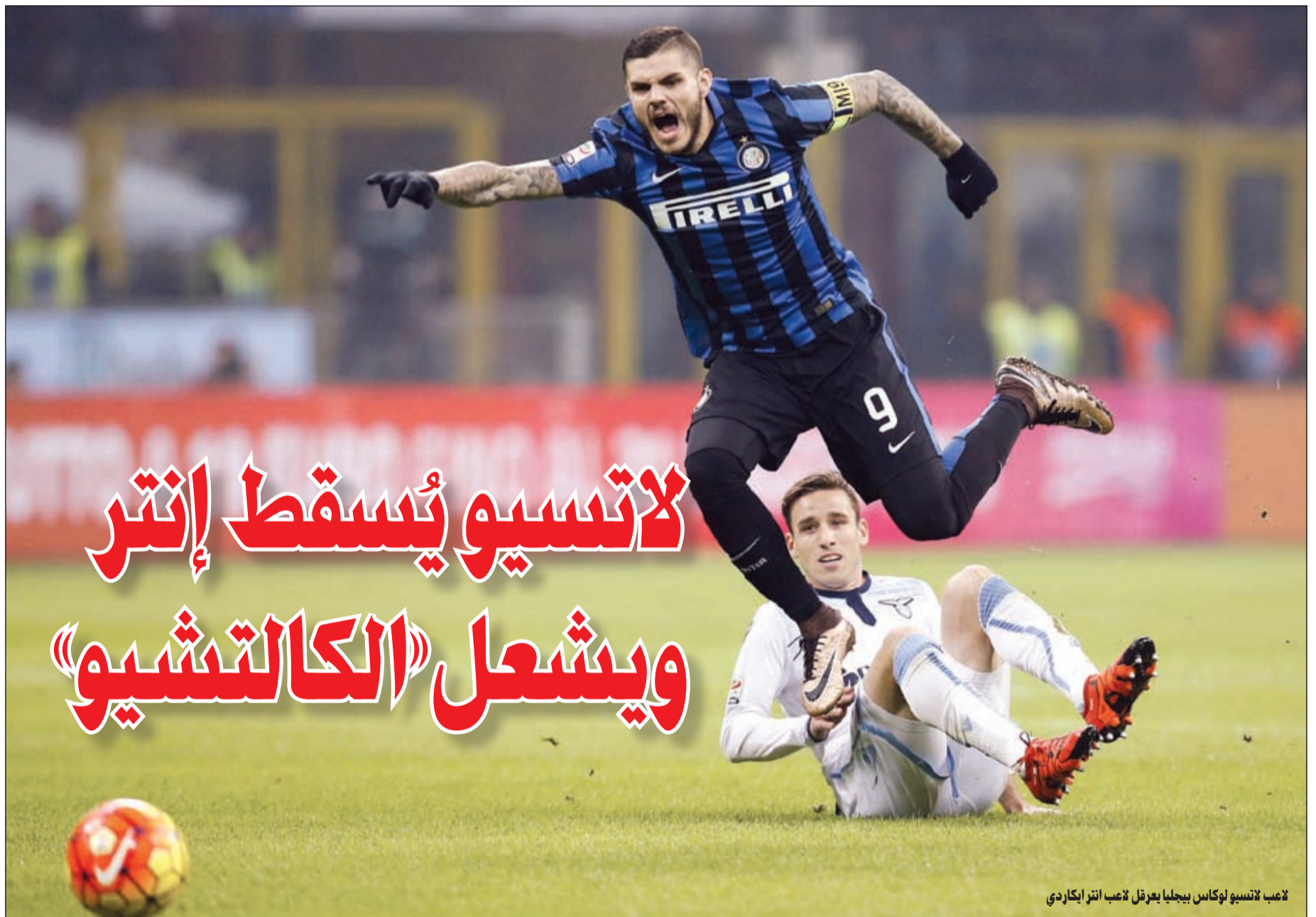
لاعب لاتسيو لوكاس بيجليا يعزف لاعب انتر ايكاردى

اعترف خوان ماتا لاعب مان يونايتد الإنجليزي بان جماهير فريقه تستحق أداء أفضل من جانب اللاعبين، متعهداً في الوقت نفسه ببدل كل ما يستطيع من أجل مساعدة الفريق على التعافي من كبوته. وتعلت صيحات جماهير الفريق الإنجليزي باسم المدرب البرتغالي جوزيه مورينيو أثناء المباراة التي خسرها يونايتد ضد نورويتش سيتي، كما دعت للاستعانة به بدلاً من فان غال. وقال ماتا: «لا يعنيتي مدى صعوبة الموقف، أنا لا أفكر في الاستسلام.. هذه هي طريقة عملي يوماً تلو آخر، أسعى إلى تقديم أقصى ما يمكنني بصرف النظر عما إذا كانت الأمور تسير بشكل جيد أو سيئ.. أؤمن بأن السبيل الوحيد للخروج من هذا المازق الصعب هو العمل باستمرار وأن الأمور ستتحسن أجلاً أو عاجلاً». وتابع: «إنه وقت الاستعداد للمباراة القادمة لإظهار قوتنا كفريق.. إذا تمكنا من اللعب بشكل جيد في المباريات التي ستقام خلال فترة أعياض الميلاد فأننا سنستطيع بدء مرحلة جديدة من النتائج الجيدة». واستخبر اللاعب الإسباني مخاطباً جماهير فريقه: «نشعر بخيبة أمل لأننا لم نتمكن من استحقاقه لأن مساندتكم مدهشة ولا حدود لها ولكنني أتق بأننا سنغير هذا الموقف كلياً».