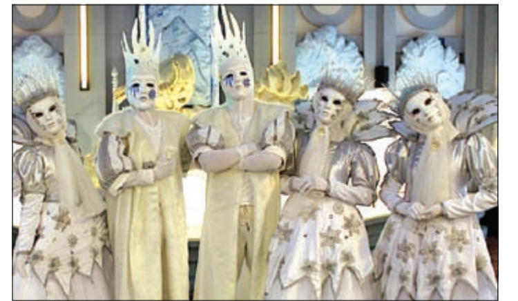
ملك وملكة الجليد

عرض الشتاء الحضري «رحلة إلى القطب المتجمد الشمالي»، والذي تتابع فيه شخصيات كيدزانيا رحلتها إلى القطب الشمالي لمقابلة أصدقائهم البطاريق والديبة القطبية، كما سيسعد الأطفال أيضا بالاستعراض الموسيقي الحي والمميز «حكاية الشتاء». ويقام مهرجان الشتاء في كيدزانيا في موسم الشتاء من كل عام، ويهدف إلى تعريف الأطفال بطبيعة البيئة الشتوية، والحيوانات التي تعيش فيها بصورة واقعية. مهرجان الشتاء في كيدزانيا مستوحى من حق المشاركة، وهو أحد الحقوق الأساسية الخمسة للأطفال في كيدزانيا الذي تمثله حماية الحقوق المحبة للموضة والأزياء، تشيكا.