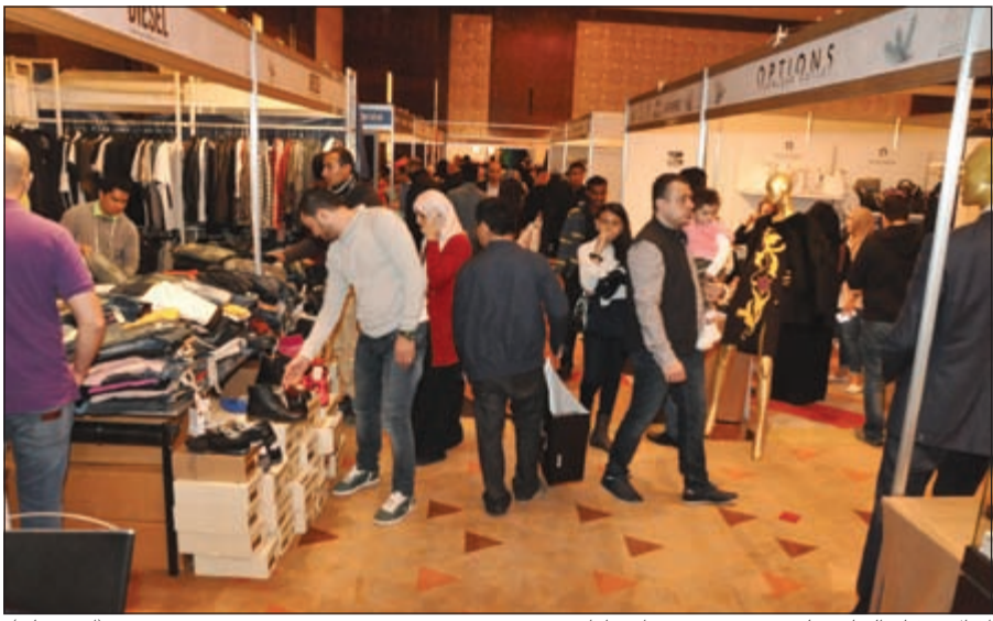
إقبال منقطع النظير على معرض سوپر براند بازار (أحمد علي)