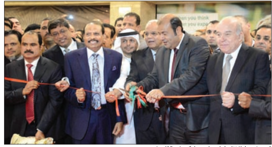
تم شريط افتتاح لولو هايبر ماركت في القاهرة

حيوي لنجاحنا على المدى الطويل لأنه يساعد في خلق المعيشة المجتمعية المستدامة. حاليا، هناك أكثر من 800 المصري العاملين في الهايبر ماركت الجديد في القاهرة ونحن عازمون على توظيف أكثر من 10000 مصري في العامين القادمين، لدينا بالفعل أكثر من 3000 مصري يعملون في متاجرنا في دول مجلس التعاون الخليجي، حيث نقوم بتدريبهم بشكل مستمر في جميع خططنا المختلفة.