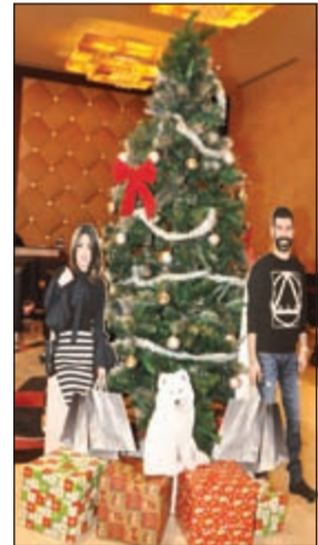
هدايا عيد الميلاد ورأس السنة