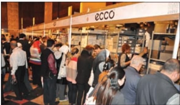
جمع غفير في المعرض