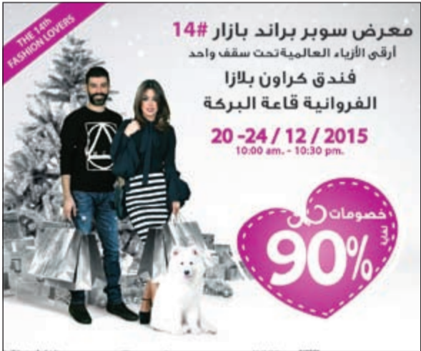
معرض سوپر براند لجميع الاذواق