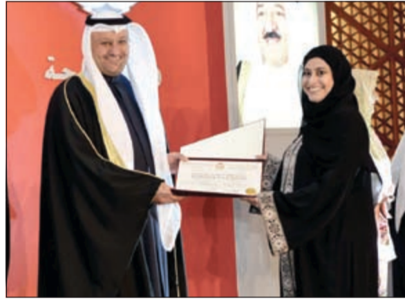
خريجة تتسلم شهادتها

الخارجية لتحقيق التغطية الشاملة. وفيما يخص زيادة عدد المقاعد المتباعدة للخارج قال: هناك تعاون كبير من قبل ديوان الخدمة المدنية، وكل عام يعطوننا زيادة في عدد المقاعد في البعثات، وهذا يعطي فرصة أكبر للأطباء والطبيبات بأن يكون لهم حظ في البعثات، المحلية أيضاً. وأضاف أن ما نحصده ثماره اليوم هو نتيجة جهد ومثابرة وإصرار على التحصيل والتزود بالجدد في العلوم الطبية من جانب زملائنا الخريجين الذين هم تتكامل التخصصات في البرامج المحلية مع تخصصات البعثات