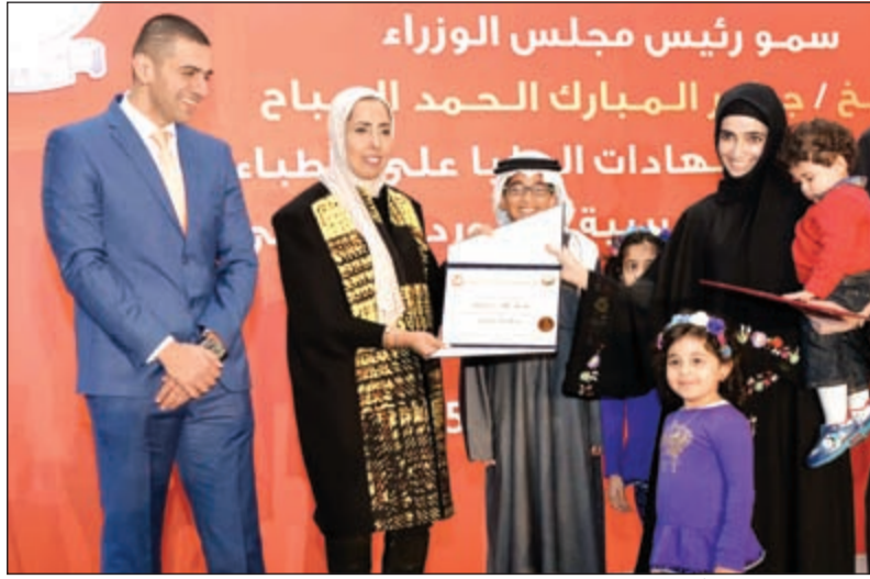
إحدى الخريجات مع أسرته