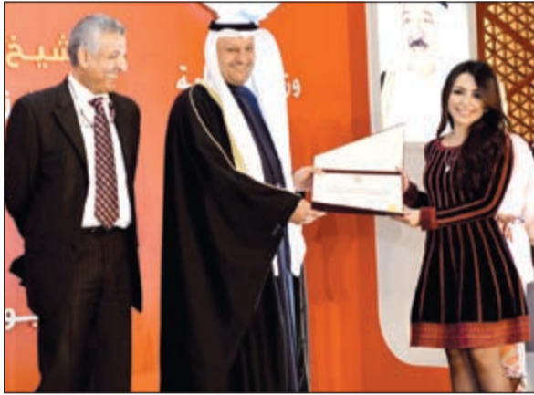
..وخريجة اخرى تتسلم شهادتها

وورش العمل وتبادل الخبرات مع المراكز العالمية المتخصصة، مؤكداً أن وزارة الصحة تحرص على تنفيذ ذلك ضمن برنامج عملها في إطار برنامج عمل الحكومة والخطة الإنمائية للدولة. وأعرب العبيدي عن ثقته بأن الخريجين سيجربون على متابعة المستجدات العالمية والمتابعة والحرص على تطبيق أحدث البروتوكولات وسياسات العمل التي تحقق للمرضى ما يستحقونه من رعاية صحية وفقاً لأحدث المستجدات مع المحافظة على حقوق المرضى وخصوصية المجتمع، مضيفاً أن هذه المناسبة تجسد اهتمام وزارة الصحة والدولة بالعنصر البشري المؤهل والمدرب ضمن