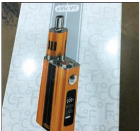
السجناء الإلكترونية غير المرخصة