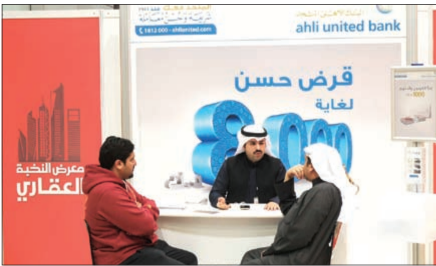
جناح البنك الأهلي المتحد في معرض النخبة العقارية

وأضاف البنك: نحن فخورون للغاية بالإقبال الكبير الذي شهده جناح المعرض الذي أبدوا اهتماما بالمنتجات التمويلية التي يقدمها البنك الأهلي المتحد والتي وجدوا فيها توافقا كبيرا مع تطلعاتهم واحتياجاتهم.