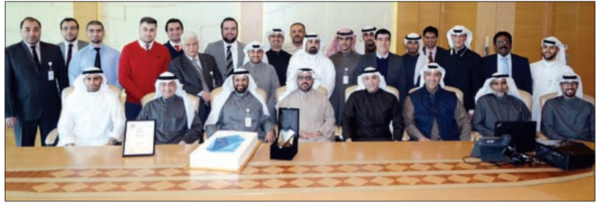
جسار الجسار منتمو موظفي مجموعة الخدمات المصرفية للشركات في بنك وربة

والمميز الذي شكّل أساس البنين في نجاحات وإنجازات بنك وربة الأخيرة والجوائز التي أضيفت إلى سجله وأخرها جائزة أفضل بنك للشركات في الكويت، حيث بذلوا جهدا ميمرا منذ إنطلاقته واستطاعوا تلبية احتياجات العملاء من الشركات ومعالجة وإيجاد حلول عملية وسريعة تناسب تطلعاتهم. وأضاف: نحرص في بنك وربة على تحفيز وتشجيع موظفينا وحظهم على المثابرة وبذل المزيد من الجهود لتحقيق المزيد من النتائج للارتقاء بالبنك عبر تبني أعلى معايير الكفاءة والمهنية في تحقيق كافة التعاملات المصرفية وتوسيع قاعدة العملاء واغتنام الفرص المتاحة في السوق، والسعي الدائم إلى تعزيز العلاقة مع الشركات في قطاع التمويل والحلول المبتكرة التي تتميز بها في هذا المجال، بما يعكس النمو المستدام في جميع أعمالنا ورفع حصة بنك وربة في السوق المحلي لاسيما في المحفظة التمويلية، وقد عكس الفوز بهذه الجائزة المرموقة من «بانكر ميدل إيست» الخدمة المميزة والراقية التي قدمها موظفو قطاع الشركات للعملاء من خلال تطبيقهم أفضل الخطط التسويقية