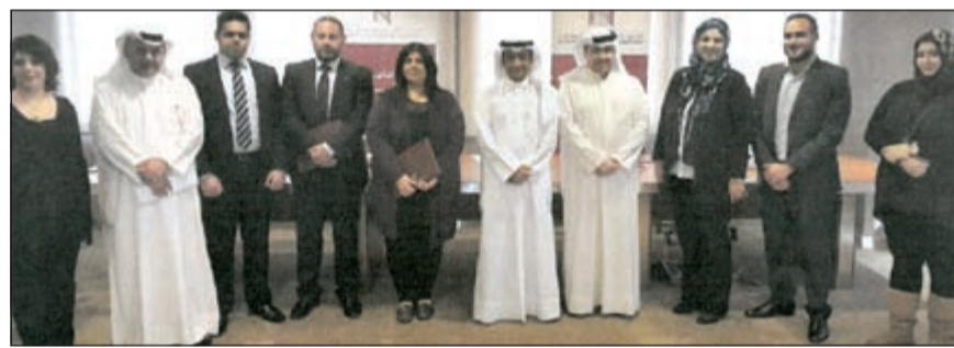
لقطة جماعية للموظفين المشاركين بالدورة

المعلنة وتوضيح مستوى المخاطرة المقبولة لكل عميل، وذلك عبر تنوع المحفظة الاستثمارية حسب نوع الأصول وحجمها، وحسب القطاع وبشكل جغرافي لمعدل السيولة المطلوبة. وتعبيراً عن حرص مجلس الإدارة والإدارة