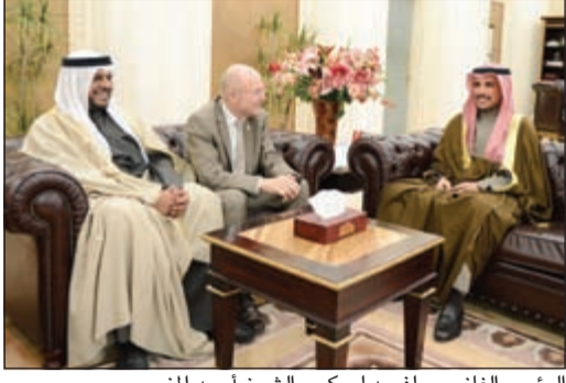
الرئيس الغانم وويلفريد ليمني والشيخ أحمد المنصور

استقبل رئيس مجلس الأمة مرزوق الغانم في مكتبه أمس نائب السكرتير العام للأمم المتحدة ومستشاره الخاص لشؤون الرياضة من أجل التنمية والسلام ويلفريد ليمني يرافقه مدير عام هيئة الشباب والرياضة الشيخ أحمد منصور الصباح.