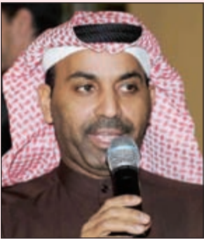
النجم طارق العلي

أكد نائب رئيس نقابة الفنانين النجم طارق العلي أن مشاركة أي فنان أو عمل في أي مهرجان يصعب في مصلحة الفن الكويتي والخليجي والعربي. وقال: أحب أن أهنئكم على فوزكم في هذا المهرجان، والاحتجاج الذي حدث على النتائج ليس احتجاجاً على «العريس» كعمل مسرحي، ولكن المسرح الكويتي فقط هو ما اعترض على النتيجة، وتم إيضاح بعض الملاحظات للأمين العام للمجلس الوطني للثقافة والفنون والآداب لتداركها في الدورات المقبلة.