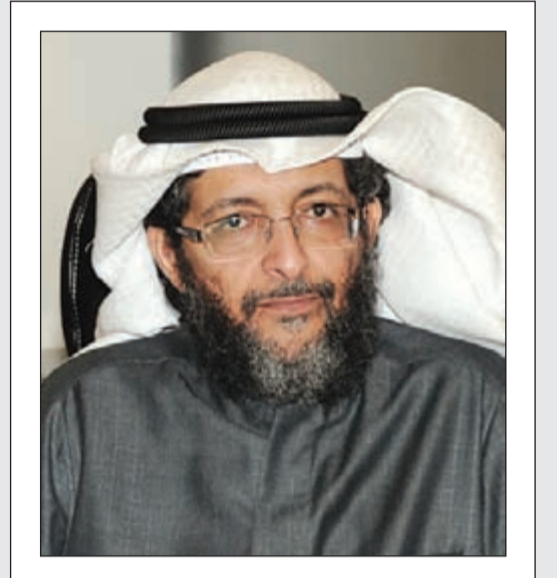
الشيخ يوسف السويلم