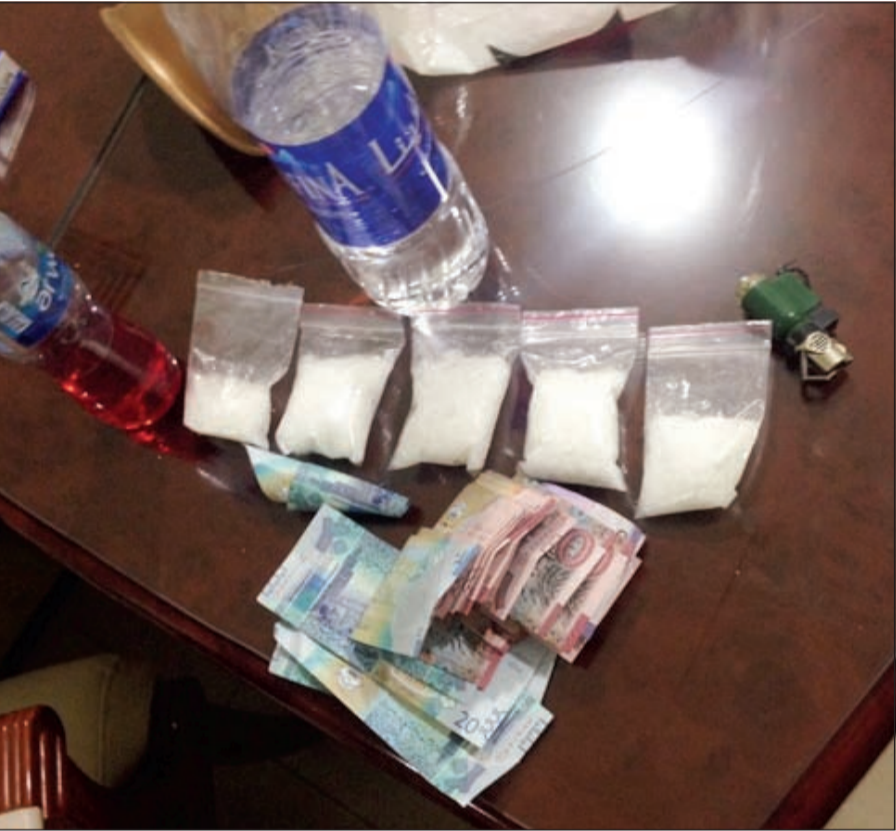
اكياس الشبو المضبوطة مع الخليجي