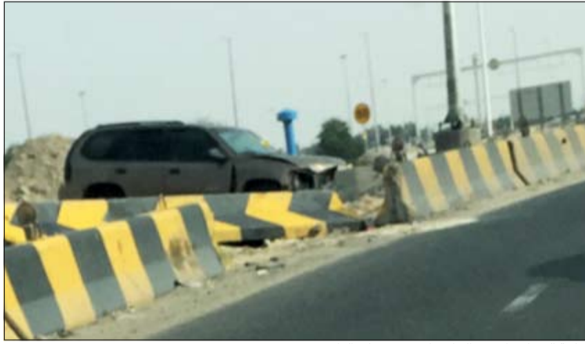
المركبة التي اصطدمت بالحاجز الاسمنتي على الرابع