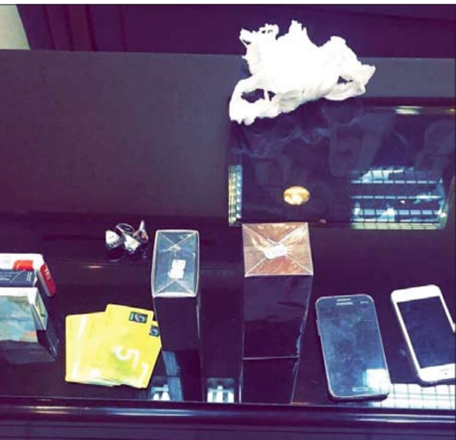
العطور التي ضبطت مع الحدثين المتهمين