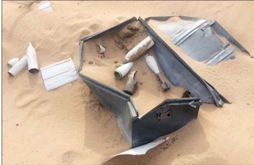
القذائف كما عثر عليها