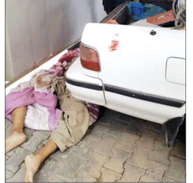
جثة الأفغاني بعد مقتله

● أخذ الأفغاني مني نقودا وهي 3000 دينار قبل أشهر بحجة مشاركتي في مشروع وطالبته بارجاعها بعد أن عرفت أنه لا يوجد مشروع كما أوهمني إلا أنه بدأ يتهرب مني وبعد أن شاهدته في ذلك اليوم وبدانا بالكلام تطور الحديث واشتد وكان في المكان