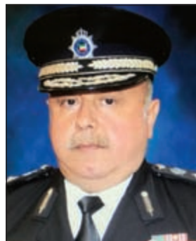
الفريق سليمان الفهد