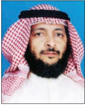
الداعية يوسف السليم