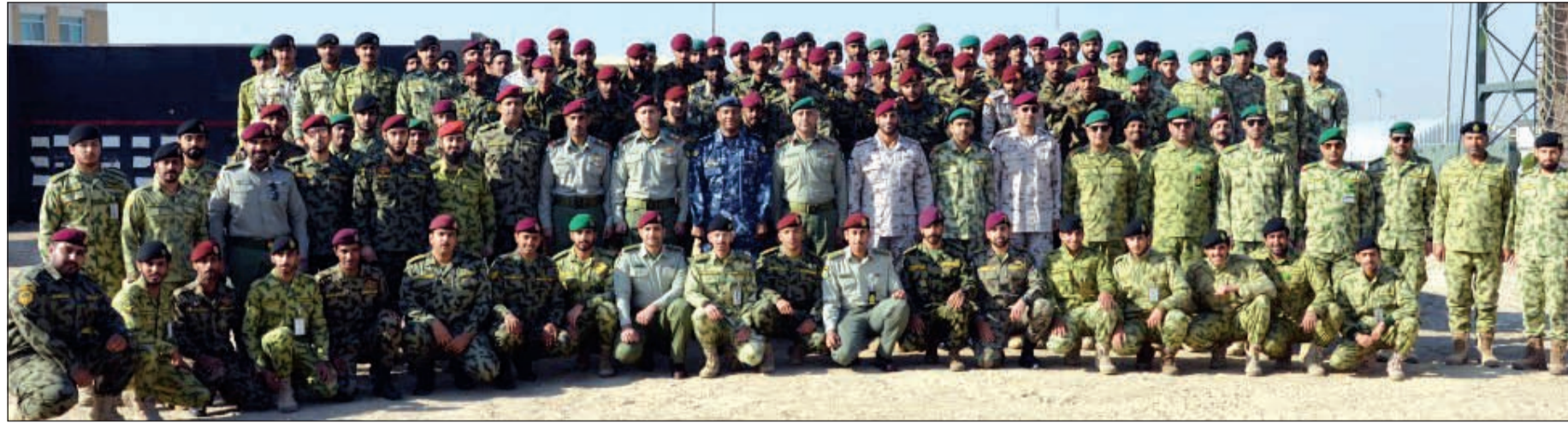
الخريجون في لقطة جماعية

أقيمت في ميدان معسكر الصمود بالحرس الوطني فعاليات تخريج 5 دورات مشتركة بين الحرس الوطني والحرس الأميري وحرس مجلس الأمة، وهي: «التفتيش الوقائي»، و«القتال في المناطق المبنية»، و«أمر آلية الباندور مدفع 25 ملم الحديثة»، و«رامي آلية الباندور مدفع 25 ملم الحديثة»، و«سباقة وصيانة آلية الباندور 25 ملم الحديثة». وألقى أمر لواء الحماية العقيد الركن حمد سالم أحمد كلمة أكد فيها أن المتابعة المستمرة والتوجيهات الحثيثة من القيادة العليا للحرس الوطني ممثلة في رئيس الحرس الوطني سمو الشيخ سالم العلي، ونائب رئيس الحرس الوطني الشيخ مشعل الأحمد، وبمتابعة من سعادة وكيل الحرس الوطني الفريق الركن م.هاشم عبدالرزاق الرفاعي، كان لها الأثر الكبير في رفع كفاءة مستوى التأهيل والتدريب التخصصي في الحرس الوطني.