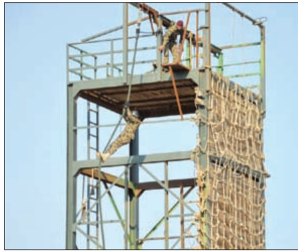
جانب من التدريب

واشتمل الاحتفال على فعاليات متنوعة في الرماية، وكيفية القياس بإجراءات التفتيش الوقائي والتعامل مع الأشخاص الخطرين والسيطرة عليهم في أوقات قياسية، حيث أبدى المشاركون مهارات عالية عكست المستوى المتميز الذي وصل إليه التدريب في الحرس الوطني. حضر الحفل عدد من الضباط في الحرس الوطني والحرس الأميري ووزارة الداخلية.