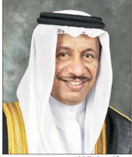
سمو الشيخ جابر المبارك

غير الديون الخارجية من الافراد والاقارب والعجز التام عن السداد. ● البيانات لدى «الانباء»