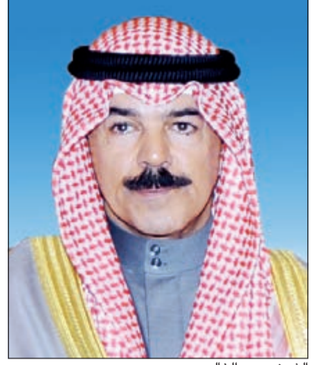
الشيخ محمد الخالد

ناشد «بدون» سابق نائب رئيس مجلس الوزراء ووزير الداخلية الشيخ محمد الخالد صاحب القلب الكبير بان يطلق سراح ابنه