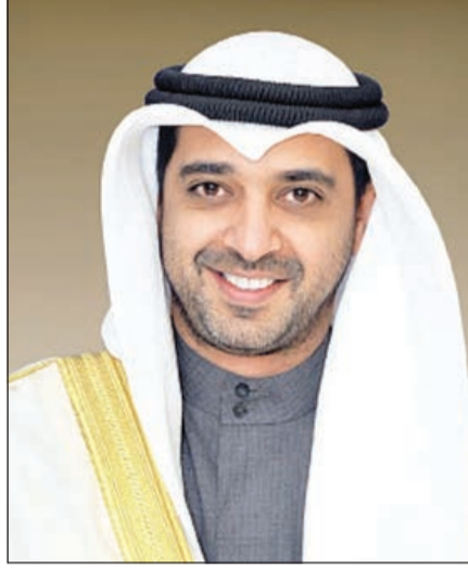
الشيخ محمد العبدالله

ناشد شاب عربي الشيخ محمد العبدالله وزير الدولة لشؤون مجلس الوزراء مساعدته في رسالة أرسلها عبر الفاكس حيث قال في رسالته: إلى حضرة الشيخ محمد العبدالله المبارك الصباح حفظه الله ورعاه (وزير الدولة لشؤون مجلس الوزراء) أنا شاب من مواليد الكويت يتيم الأب، وكما قال النبي ﷺ «أنا وكافل اليتيم كهاتين في الجنة» بحاجة لمساعدتك المادية بمبلغ 500 دينار لسداد ديون علي أرجو يا طويل العمر مساعدتي بذلك وجعله الله في ميزان حسناتكم ولك مني الدعاء والشكر الجزيل.