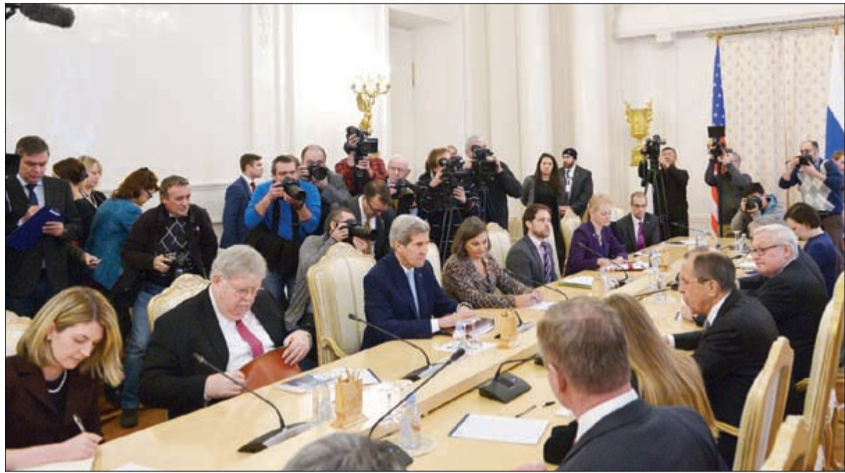
جانب من مباحثات وزير الخارجية روسيا وأميركا في موسكو أمس

وأضاف: «أعتقد أن العالم يستفيد عندما تكون لدى دولتين قويتين لكل منهما تاريخ طويل مع الأخرى إمكانية أن تكونا قادرين على إيجاد أرضية مشتركة». وخطب كيري نظيره الروسي قائلا: «حتى عندما تكون هناك خلافات بيننا نقرر على العمل بفاعلية في قضايا معينة». وأشاد كيري - خلال محادثاته مع لافروف - بروسيا كمساهم كبير في التقدم الذي أحرز بشأن سورية، قائلا «إن روسيا والولايات المتحدة على حد سواء تؤمنان بأنه ينبغي التخلص من تنظيم داعش». وأوضح أن روسيا والولايات المتحدة تتفقان على أن داعش يمثل تهديدا للجمعيات أشخاص وبلدان، وهم أسوأ من الإرهابيين، حيث إنهم يهاجمون الحضارة والتاريخ والأخلاق، مؤكدا أنه لا يوجد خيار أمام الدول المتقدمة سوى الوقوف صفا واحدا أمامهم ومحاربتهم وتدميرهم. وطلب من لافروف الضوء على القضايا العالقة