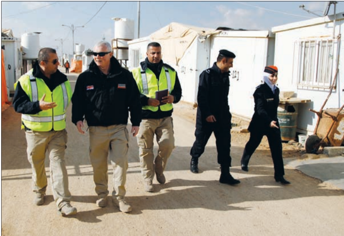
الاردن يبدأ بتسيير دوريات للشرطة الاجتماعية في مخيم الزعتري

عواصم - وكالات: نفى الجيش السوري الحر التصريحات التي ادلى بها رئيس هيئة الأركان الروسية والتي قال فيها إن الجيش الروسي يقدم دعما عسكريا له في سورية.