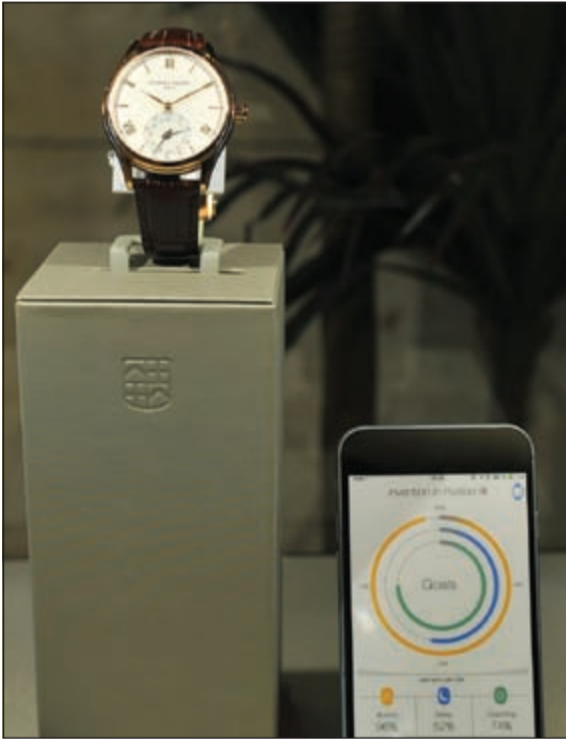
ساعات «فريدريك كونستان» تشغل بنظام «موشين اكس - 365®»

الفوائد النوعية التي تمنحها التكنولوجيا الحديثة، وكل ذلك من دون الحاجة لإعادة تعبئة البطارية.