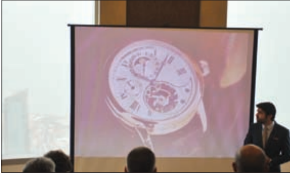
جانب من عرض ساعات فريدريك

وستستمتع ساعة «فريدريك كونستان» الذكية الوظائف التالية: الاطلاع على الوقت والتاريخ الصحيحين لتكون دائماً على