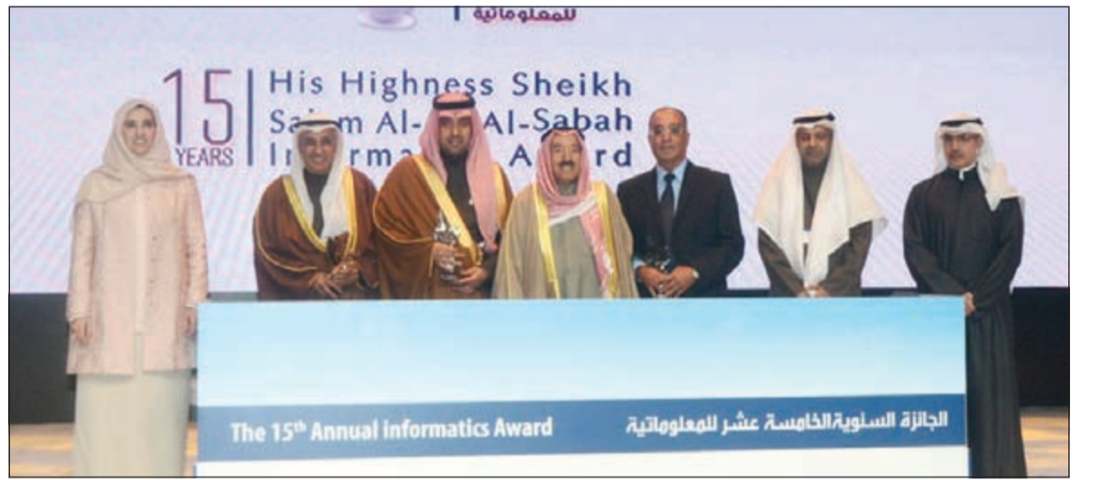
صاحب السمو الأمير الشيخ صباح الاحمد والشيخة عابدة سالم العلي أثناء تكريم مستشفى طبية

مستشفى طبية بالمركز الثاني في مجال الصحة، ومستشفى دلة العام في المملكة العربية السعودية بالمركز الأول.