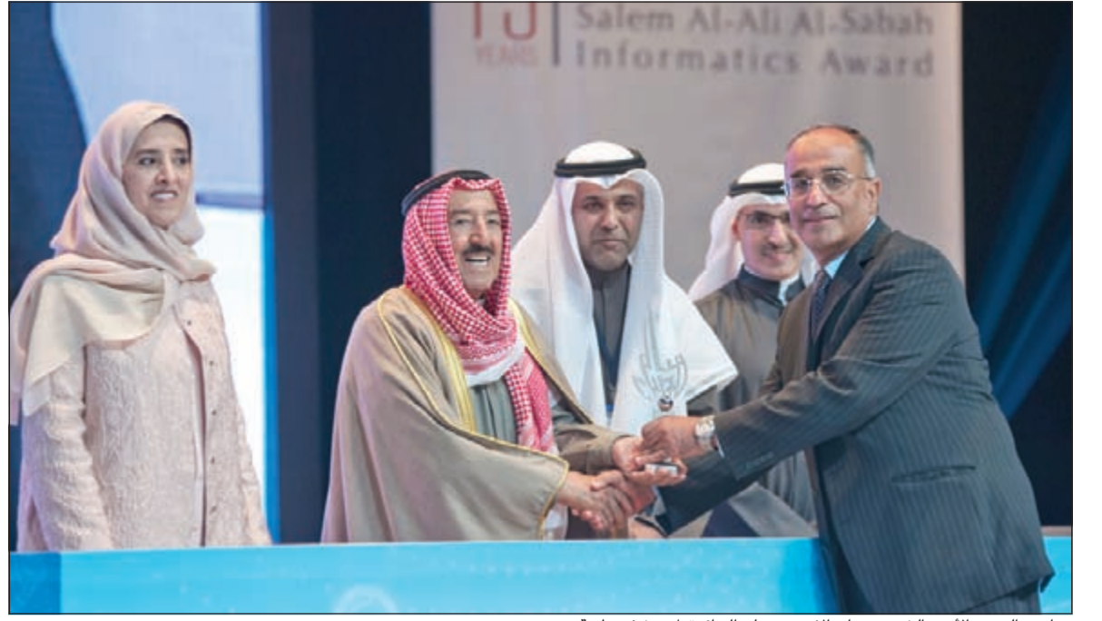
صاحب السمو الأمير الشيخ صباح الاحمد يسلم الجائزة لمستشفى طبية