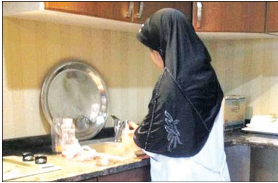
القانون كفل للعامل المنزلي حقوقه