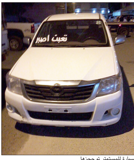
سيارة للمستهتر تم حجزها

ما تم تحرير عدد من المخالفات. من جانب آخر، شن رجال امن الفروانية حملة على منطقة صباح الناصر وتم ضبط 11 مركبة واحالتها الى الحجز، كما تم تحرير مخالفات تخص المركبات المخالفة لقانون المرور. وقال مصدر امني ان رجال امن مبارك الكبير قاموا ايضا بضبط 3 مركبات سجل بحقها قضايا سرقة واعادتها الى اصحابها، كما تم احتجاز مركبتين لعدم حملها لوحة امامية بالإضافة الى مخالفة قانون المرور.