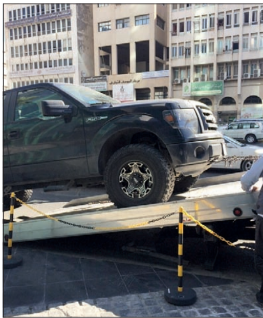
أحد المركبات التي تم ضبطها في الحملة