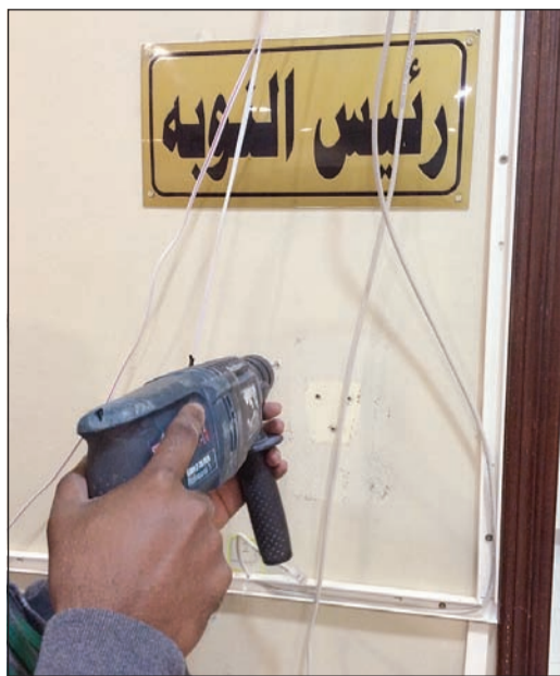
عملية بدء تركيب أجهزة البصمة

العمل فيها بهذا النظام. وقال مصدر في الجمارك: ان جميع المنافذ البرية سيتم وضع جهاز البصمة فيها لضبط حركة دخول وخروج الموظفين بوقت العمل، كما اشار المصدر الى ان المتفدين