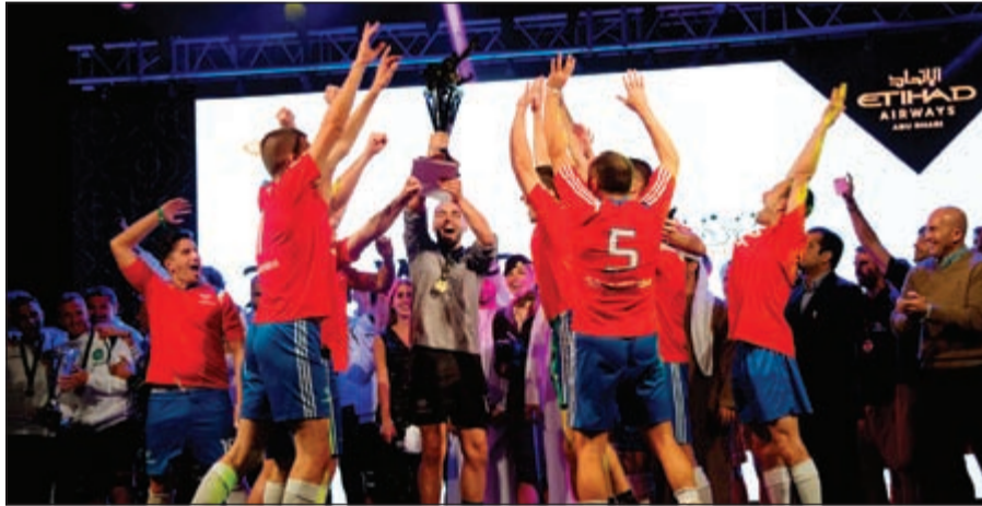
«الاتحاد للطيران» تتوج فريق طيران صربيا في ختام بطولة كرة القدم

جمعت الاتحاد للطيران، الناقل الوطني لدولة الإمارات العربية المتحدة، ما يقرب من مليون درهم إماراتي لدعم حملة «عونك يا يمن» والمساعدة في تجديد مدرستين في كينيا، وذلك في إطار الحملة الخيرية السنوية لجمع التبرعات بالتعاون مع هيئة الهلال الأحمر الإماراتي. وتم الإعلان عن التبرعات خلال حفل ختام بطولة كرة القدم لشركات الطيران العالمية ومهرجان الأزياء والمكولات، الذي نظمته اللجنة الرياضية والاجتماعية في الاتحاد للطيران في منتج الفرسان الدولي الرياضي. وشاركت الفرق الرياضية التي قدمت من 28 شركة ومجموعة دولية للطيران في الفعالية، وتم تكريم الفرق الثلاث الفائزة خلال الحفل الذي ضم تشكيلية واسعة من الأنشطة المتنوعة مثل النقش بالحناء وفقرات موسيقية وغنائية وفقرات لرقص البالمة، ومسابقة للأزياء حصل فيها الفائزان الأول والثاني على باقة سفاري إلى كينيا.