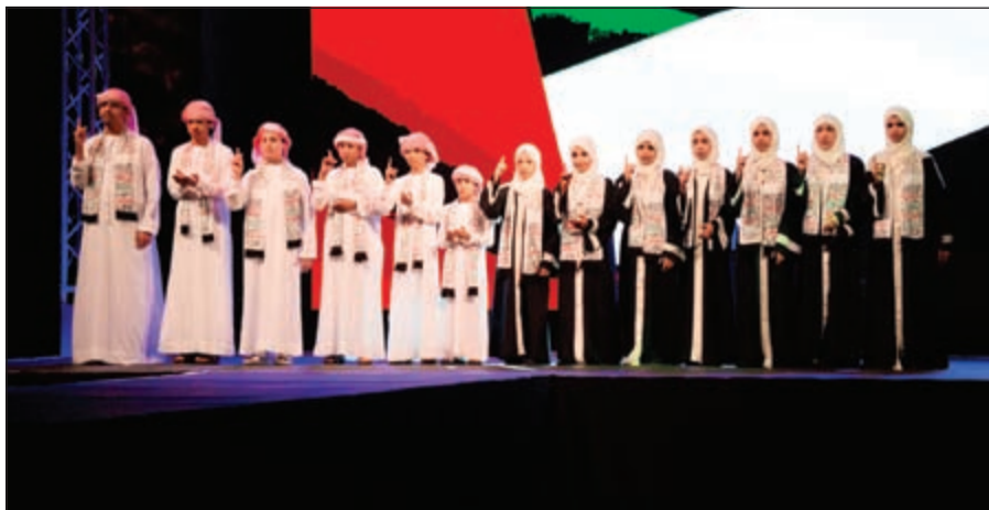
الأوركسترا الوطنية للمصم في الإمارات تبدأ مراسم الحفل بالمشيد الوطني للدولة

وتأتي مبادرات الشركة لدعم حملة «عونك يا يمن» وكينيا، في إطار اتفاقية أبرمت بين الاتحاد للطيران وهيئة الهلال الأحمر الإماراتي للتعاون الإنساني والاجتماعي. وحضر الحفل خديجة عيسى يوسف، سفيرة جمهورية كينيا في الإمارات وحفيد الشامي، نائب الأمين العام لشؤون المساعدات الدولية في هيئة الهلال الأحمر الإماراتي، والدكتورة خولة سالم السعيد، ممثلة رئيس الرابطة الدولية للمرأة والصحة.