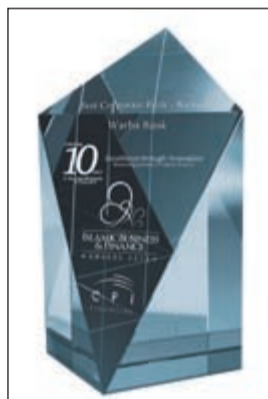
جائزة أفضل بنك للشركات

وحول الحدث، قال العبيد: يسعدنا أن نختم العام 2015 بهذه الجائزة المرموقة الثالثة من نوعها والتي تصاف إلى سجل بنك وربة الذهبي وتؤكد مرة جديدة على مكانة البنك في السوق الكويتي بوصفه الخيار الأفضل للعملاء أفرادا وشركات. وأضاف العبيد: سعداء بهذه الجائزة وفي الوقت نفسه فخورة بالنتائج التي حققها بنك وربة خلال مسيرته القصيرة كأحدث بنك إسلامي في السوق الكويتي، الأمر الذي يعكس النشاط المتنامي للبنك وسعيه الدائم لتلبية احتياجات العملاء والبحث عن فرص جديدة ومجدبة بوسائل وخدمات مبتكرة، لا سيما في قطاع تمويل الشركات وتوفير متطلباتهم التمويلية بأسلوب عصري متوافق مع أحكام الشريعة الإسلامية. وبفضل الله تم جهود الموظفين تمكن بنك وربة من الاستحواذ على ثقة العملاء من الشركات وأصبح وجهتهم الأولى للحصول على التمويل أو الخدمة التي يريدهونها مستفيدين في الوقت ذاته من التسهيلات الكبيرة التي نقدمها، لا سيما على صعيد سرعة إنجاز المعاملات من خلال تخصيص بنك وربة موظف للخدمات المصرفية للشركات في جميع فروع لتقديم أفضل خدمة لهم وتسهيل الوصول إلى حساباتهم وتنفيذ عملياتهم بشكل فوري، مع الاستمرار في تقديم الحلول المبتكرة لهم، ونتيجة لهذا نجح بنك وربة