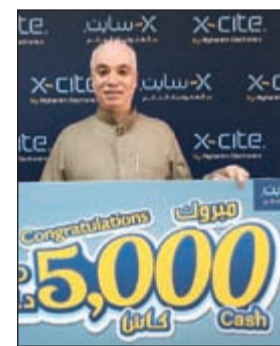
الفائز بالجائزة الثانية