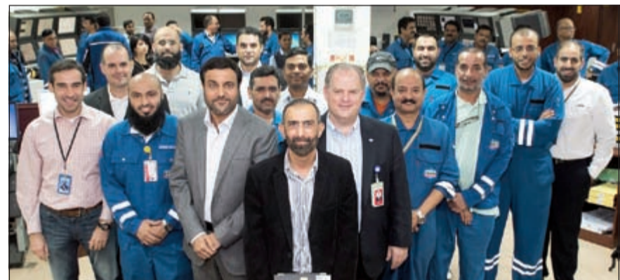
موظفو «الكويت» مع جائزة الابتكار التكنولوجي المقدمة من الدار

وتم اختيار بنك وربة لهذه الجائزة من مؤسسة «سي بي آي فاينانشال» التي تدير جوائز التمويل والعمل المصرفي، وتنتشر عددا من أهم المجالات المالية في العالم بينها مجلة «بانكر ميدل إيست»، بناء على توصيات لجنة تحكيم خاصة مؤلفة من خبراء مستقلين في قطاع المصرفية، حيث تم التقييم وفق معايير الصحة والأسس والمؤشرات المالية وقام خبراء المجلة بالتصويت لأكثر الفئات من ضمن قائمة من المرشحين على الفئات المحددة.