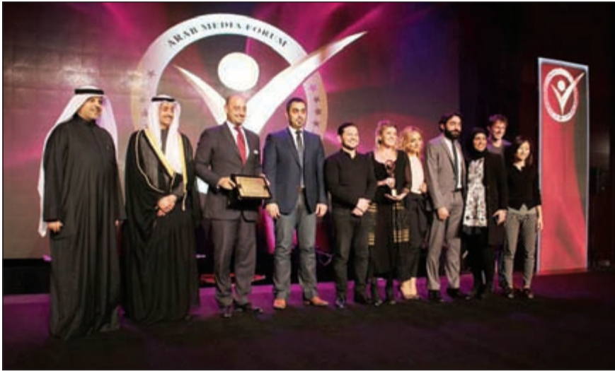
جانب من حفل التكريم

توصيل الطلب. ومن منطلق المبادرة والمشاركة في الأعمال الخيرية داخل المجتمع، تقوم الشركة بالتبرع بجزء من إيراداتها للجان وفئات خيرية بالنيابة عن العمل، وذلك بدون إضافة أي تكاليف أو رسوم على قيمة الطلب. للمزيد من المعلومات حول موقع طلبات دوت كوم، يرجى زيارة الرابط www.talabat.com ومتابعتنا عبر مواقع التواصل الاجتماعي عبر الأنستغرام، فيسبوك وتويتر.