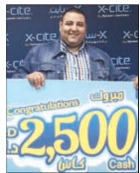
.. والفائز بالجائزة الثالثة