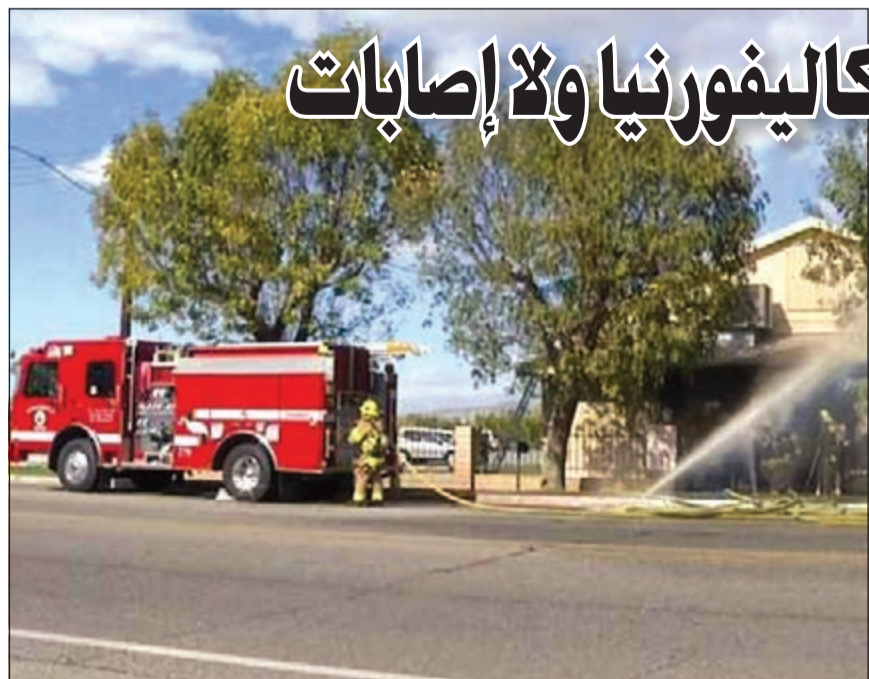
صورة عن فيديو لرجال اطفاء يخمدون الحريق في بلم سبرينغز في كاليفورنيا

عواصم - وكالات: مازال المسلمون الأميركيون يذعنون ثمن الجرائم الإرهابية التي يرتكبها بعض المتطرفين وآخرهم مهاجما سان بيرناردينو في كاليفورنيا. فقد قالت سلطات الولاية انها تحقق في حريق «قد يكون متعمدا» في مسجد بجنوب الولاية ووصفته بأنه «جريمة كراهية محتملة». ويقع المسجد في مكان غير بعيد عن سان بيرناردينو حيث نفذ زوجان من أصل باكستاني هجوما أدى إلى مقتل 14 شخصا.