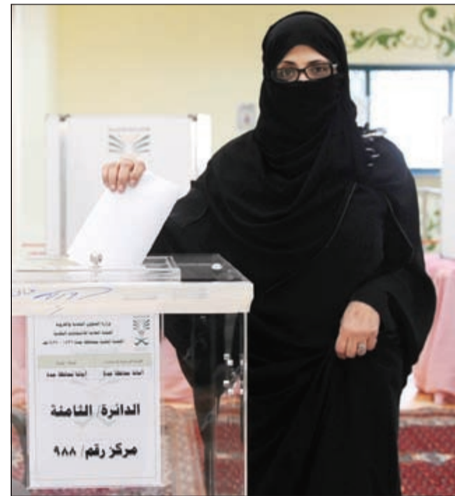
ناخبة سعودية تنلي بصوتها في الانتخابات البلدية في جدة امس

الرياض - وكالات: أغلقت صناديق الاقتراع في السعودية أمس على أول انتخابات بلدية تشارك فيها النساء بالتصويت والترشح. ودخلت المرأة السعودية أمس منعطفا مهما في الحياة السياسية حيث نافست 979 سيدة سعودية شقيقها الرجل على 3159 مقعدا تشكل 284 مجلسا بلديا. وناهر إجمالي عدد المتنافسين من الجنسين الـ 7 آلاف مرشح ومرشحة.