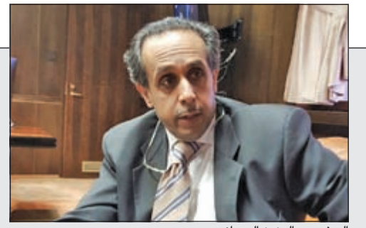
السفير عبدالعزيز العدواني

المطيري: معاملة تقدير الاحتياج لا تستغرق أكثر من 3 أيام ولا تحويل للعمالة المسجلة على المشاريع الصغيرة إلا على نفس القطاع والنشاط