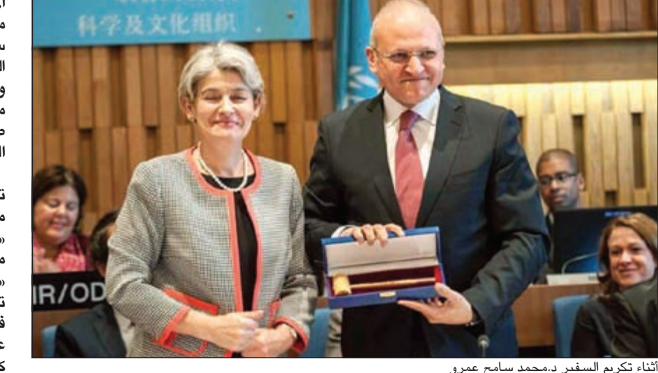
أثناء تكريم السفير د.محمد سامح عمرو

المصري برئاسة د.أماني مصطفى، بتوجيه الشكر لمحمد سامح عمرو على مجهوده الكبير في خدمة الفنون والثقافة والعلوم، ونجاحه في رفع اسم مصر عالمياً في المحافل الدولية طوال فترة رئاسته للمجلس التنفيذي لمنظمة اليونسكو. وقال الصناديلي إنه تم إطلاق صفحة على موقع التواصل الاجتماعي «فيسبوك» وهاشتاج على موقع التواصل الاجتماعي «تويتسر» بعنوان (مصر تستحق)، ونجح الجروب في ضم أكثر من 25 ألف عضو من المصريين والعرب، كلهم يدعمون حملة ترشيح