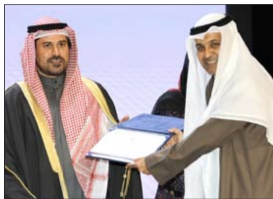
.. وتكريم آخر