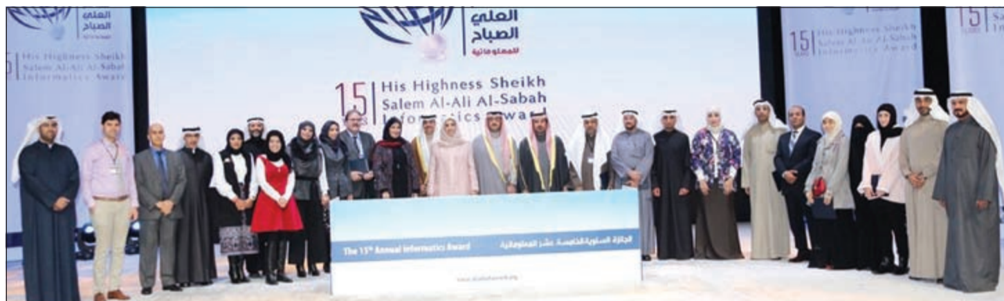
الشيخ أحمد سالم العلي والشيخ عبدالله سالم العلي والشيخة عابدة سالم العلي يتوسطون المكرمين