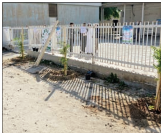
الأشجار بعد زرعها بجوار سور المسجد