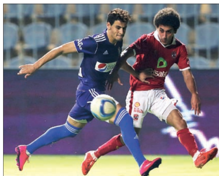
مباريات الدوري المصري تفتقد الحضور الجماهيري