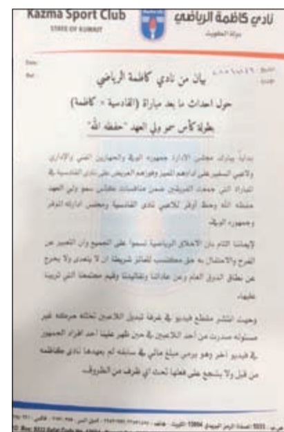
صورة بيان نادي كازمة

لم يعهدوا نادي كازمة من قبل ولا يشجع على فعلها تحت أي ظرف من الظروف. وعليه وبعد مشاهدة مقطعي الفيديو، قرر مجلس الإدارة