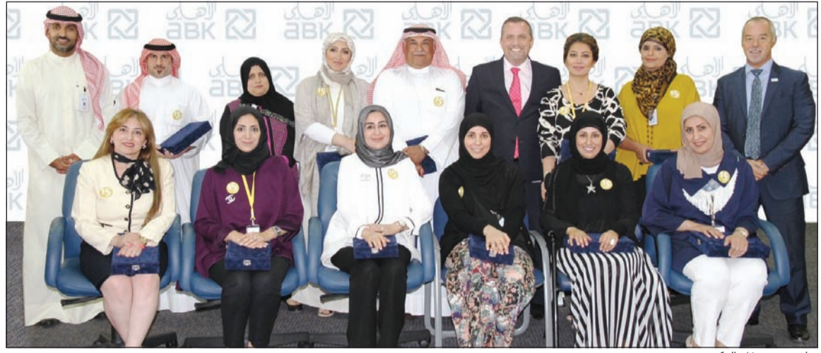
جانب من حفل التكريم

ويحرص البنك الأهلي الكويتي على تنظيم مثل هذه المناسبات لتكريم موظفيه من جميع الإدارات ممن أمضوا 5 سنوات وأكثر في خدمة البنك. ويتمتع البنك الأهلي الكويتي بسمعة طيبة في المحافظة على موظفيه، وقد تجسد ذلك من خلال تكريم 77 من الموظفين الذين أمضوا أكثر من 20 سنة فأكثر في خدمة البنك، وذلك خلال حفل توزيع الجوائز الذي أقيم مؤخراً في فندق سيمفوني.