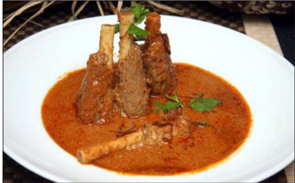
أحد الأطباق الهندية المميزة