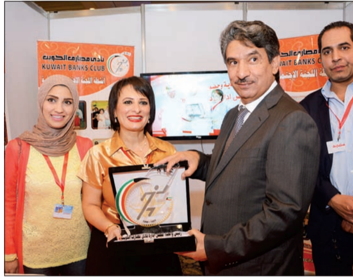
دوع تذكارية إلى السفير سالم الزمانان