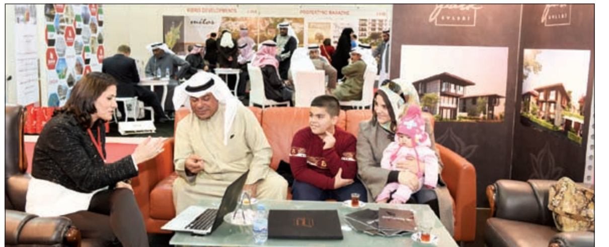
يوم الأسرة، منصة مثالية للمستثمرين من القطاع الخاص