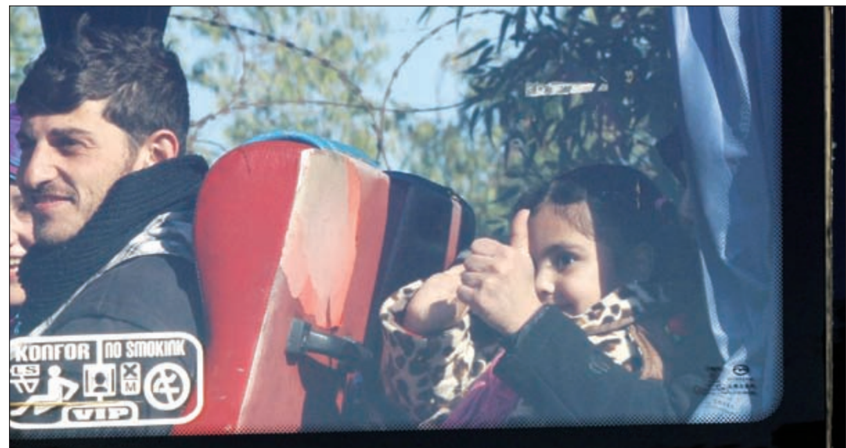
مجموعة من المدنيين الذين جرى إخلاؤهم من حي الوعر أمس

وتشرف الأمم المتحدة على تطبيق الاتفاق الذي وافقت عليه بشكل مباشر