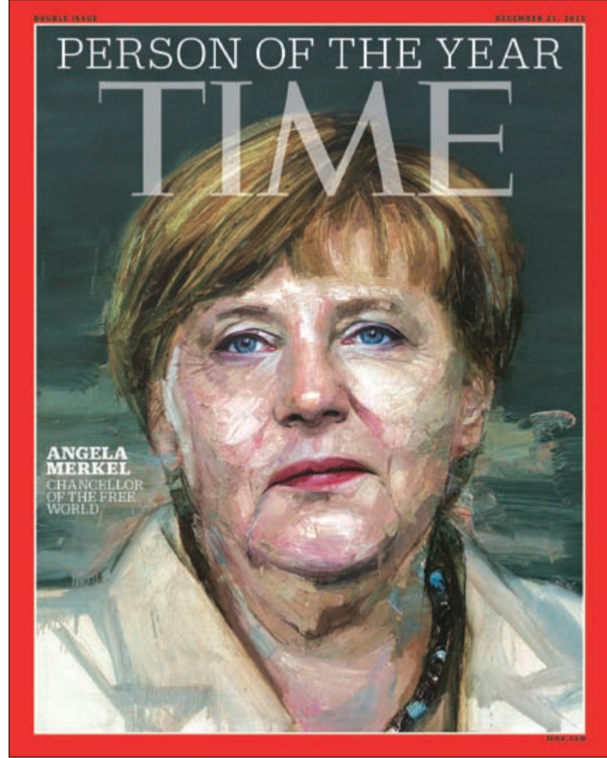
غلاف مجلة التايم وعليها صورة أنجيلا ميركل

وأدرج أبو بكر البغدادي على قائمة تايم للمرشحين للقب شخصية العام، بسبب دوره في دفع أتباعه إلى القتل في العراق وبناء الجدران وانعدام الثقة، وهي أول امرأة تحصل على اللقب منفردة خلال 29 عاماً رغم تكريم نساء أخريات الأميركية.