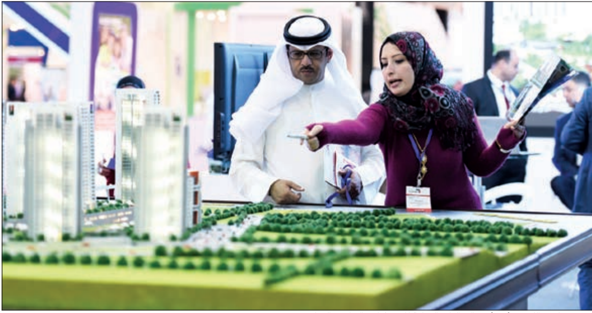
سيتي سكيب الكويت أحد أبرز الفعاليات الدولية للاستثمار والتطوير العقاري

على حد سواء. وسيتم استعراض ثلاثة مشاريع عقارية فريدة خلال المعرض. ويشمل مشروع تطوير جزيرة فالكون الفاخر والسذي تقدر تكلفته بعدة ملايين من الدولارات فتنين من الفيلات، فيلات شاطئية تضم خمس غرف نوم وتبدأ أسعارها من 2 مليون دولار، وفيلات المنتزه الرجحة التي تضم خمس غرف نوم وتبدأ أسعارها من 1,3 مليون دولار.